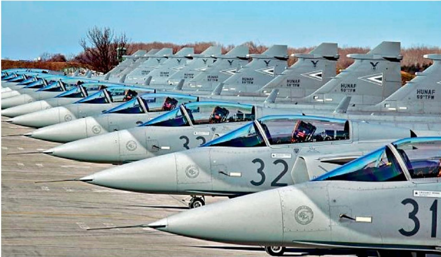
Staffel Gripen C der ungarischen Luftwaffe.

Üben dieser Abfang- und Identifikations-einsätze stellt eine der Kernaufgaben unserer Kampfpiloten dar. Für den Einsatz bei Tag und bei Nacht, bei jeder Wetterlage und in grossen Höhen, stehen heute 33 Flugzeuge F-18 «Hornet» zur Verfügung.