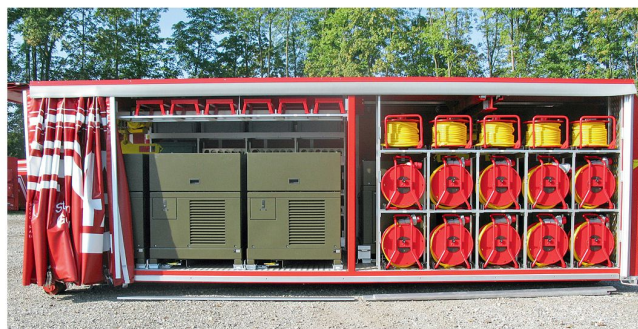
Wechselbehälter mit Stromerzeugung.

Bei Naturkatastrophen, wie dem Hochwasser im Jahre 2005 in Brienz, reicht das Arsenal von Feuerwehr und Zivilschutz teils nicht aus. In solchen Fällen kommt die Schweizer Armee unter anderem mit ihrem WELAB-System (Wechselbehälter für Katastrophenhilfe) mit zusätzlichen Ausrüstungen zum Einsatz und unterstützt Feuerwehr und Zivilschutz bei der Arbeit. (Diese Unterstützung findet subsidiär statt. Das Hilfesuch wird von den Kantonen über die Territorialregionen dem Führungsstab der Armee gestellt.) Die Schweizer Armee präsentiert im Rahmen der Sonderschau «Militärische Unterstützung bei Überschwemmungen» Komponenten aus dem WELAB-System auf rund 1800 m 2 Fläche.