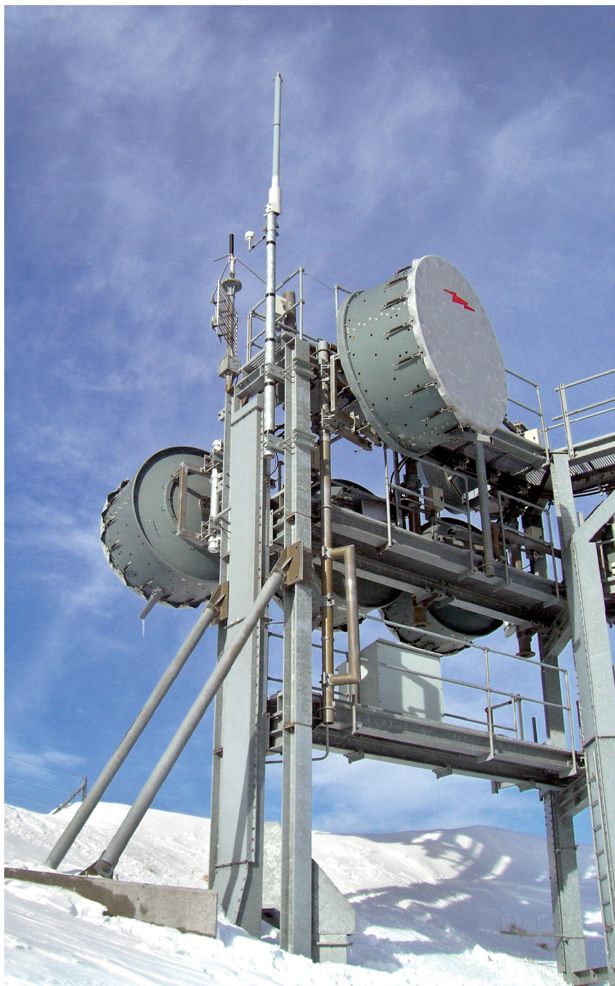
Link 16 Antenne auf einem Höhenstandort.

In Falle des Projekts FLORAKO Data Link ging es in erster Linie darum, eine grösstmögliche Interoperabilität zur einzigen anderen Plattform der Schweizer Armee herzustellen, die zum heutigen Zeitpunkt mit dem Link 16 ausgestattet ist, dem F/A-18. Gleichzeitig sollten die Kosten für die Integration der L16-Daten und der damit einhergehenden Transaktionen in die Softwareprogramme, die im FLORAKO für die Darstellung einer identifizierten Luftlage und für die Steuerung des Jagdfliegers zuständig ist, so gering wie möglich gehalten werden. Vor diesem Hintergrund wurde die Liste der zu implementierenden Mel-