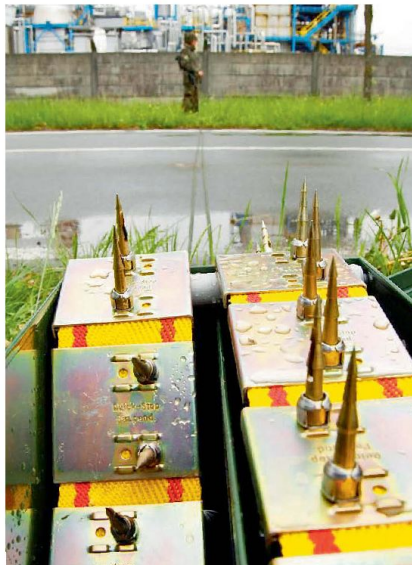
Nagelgurte im Einsatz.

Bei der Infanterie wird das Strassensperresortiment ebenfalls seit langer Zeit multi-