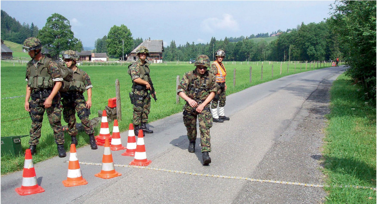
Nagelgurte am Check Point.

zen. Verlangsamten von Zielfahrzeugen beziehungsweise offensiven Fahrzeugen der Gegenseite, zum Beispiel Lastkraftwagen, auch Lastwagen oder Camions mit unkonventioneller Spreng- oder Brandvorrichtung (IED: improvised explosive devices). In temporären und oder kurzfristigen Objektschutzzeinsätzen besteht das Ziel, Fahrzeuge an der Weiterfahrt sofort zu hindern respektive die Weiterfahrtstrecke zu limitieren.