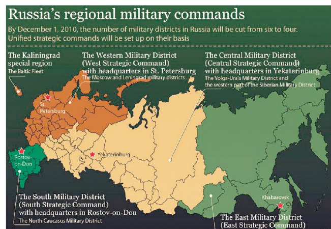
Die Regionalen Kommandos der russischen Streitkräfte.

kommandos sondern deren vier (die Strategischen Regionalkommandos West, Süd, Zentral und Ost). Diese Kommandos sind für die operativ-strategische Planung sowie Durchführung von Operationen auf Stufe Grosser Verband verantwortlich. Vorgehen ist auch, dass die bisherigen Flotten der Marine in den neuen Strategischen Kommandos integriert werden. Damit werden die betreffenden Kommandanten über Verbände aller Teilstreitkräfte verfügen. Die Funktion der verbleibenden Militärbezirke wurde neu definiert: sie sind für die Truppen-einberufung und Ausbildung der Mobilmachungsreserven sowie für Übungen und Logis-