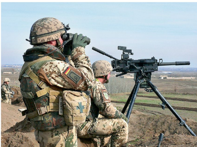
Einsatzrealität in Afghanistan bildet wichtige Grundlage für die Reform.

heutigen Divisionsstäbe, wobei dieser Schritt noch höchst umstritten sein soll. Hinzu kommen die Kommandos und Truppen der Spezialkräfte und der Luftgestützten Kräfte sowie ein Ausbildungskommando, ein Kommando Rüstung und Konzeption sowie die Einheiten in multinationalen Verbänden, z. B. die Deutsch-Französische Brigade. Noch nicht geklärt ist der Bereich der Kampfunterstützung (Artillerie und Pioniere) sowie die künftige Eingliederung der Panzertruppe. Grundsätzlich soll aber die Zahl der schweren Waffensysteme (Kampfpanzer, Artilleriegeschütze) weiter reduziert und auf die künftigen