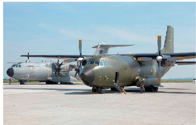
Transportflugzeuge beim EATC in Eindhoven.

grössern werde. Spätestens mit der Auslieferung der ersten Transportmaschine A400M an die europäischen Nutzerstaaten (vorgesehen im Jahre 2013) dürfte dies der Anlass zum Beitritt weiterer Nationen sein. Die 200 Soldaten der Gründernationen sind unterdessen verantwortlich für etwa 200 Transportflugzeuge mit einem geplanten Aufkommen von 60 000 Flugstunden pro Jahr. Spätestens in einem Jahr werden die Zahlen über die Kosteneffizienz dieser Organisation vorliegen und könnten dann überzeugende Argumente für einen Beitritt weiterer Nationen sein.