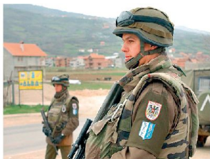
Wehrpflicht steht auch in Österreich zur Diskussion.

Nachdem sich Deutschland im Zuge der geplanten Bundeswehrreform für eine Aussetzung der Wehrpflicht ausgesprochen hat, werden nun auch in Österreich diesbezügliche Forderungen laut. Von verschiedenen Seiten, unter anderem auch von der regierenden SPÖ, wird nun eine diesbezügliche Volksbefragung verlangt. Ein Expertengutachten des österreichischen Verteidigungsministeriums soll bis Ende Jahr vorliegen; bis spätestens Ende März 2011 soll dann der Nationalrat über die Abhaltung einer Volksabstimmung