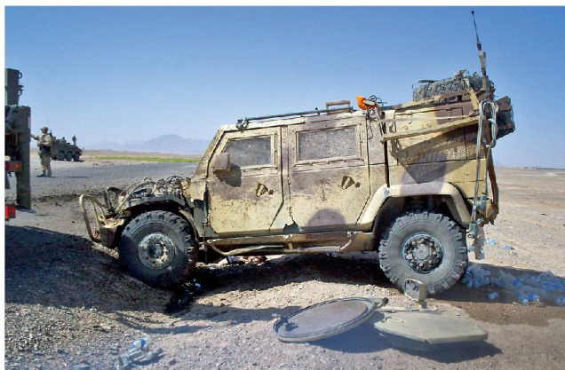
Anschlag auf LMV in Afghanistan.

Bereits seit längerem interessieren sich die russischen Streitkräfte für moderne westliche Fahrzeuge; im Vordergrund steht dabei die mögliche Einführung von gepanzerten Mehrzweckfahrzeugen LMV (Light Multirole Vehicles), die heute vor allem von Italien und Grossbritannien in grosser Zahl eingesetzt werden. Die Rede ist von einer Beschaffung von ge-