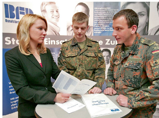
Mit Aufhebung der Wehrpflicht muss die Attraktivität der Bundeswehr verbessert werden.

den Dienstes sollen beide Seiten ein Kündigungsrecht erhalten, so wie es in der Privatwirtschaft üblich ist. Das Salär würde in diesem Zeitraum auf dem Niveau des bisherigen Wehrsolds (ungefähr 300 Euro pro Monat), später dann deutlich darüber liegen. Je nach Verpflichtungsdauer will die Bundeswehr den Bewerbern weitere Dienstanreize zugestehen. So könnten Abiturienten, die sich auf die Maximaldauer von 23 Monaten verpflichten, ein ziviler Studienplatz an einer Bundeswehruniversität in Aussicht gestellt werden. Gegenwärtig wird untersucht, wie mit Werbekampagnen und Internetauftritten die Attraktivität der Bundeswehr verbessert und wie die jungen Leute für einen Militärdienst angeworben werden können.