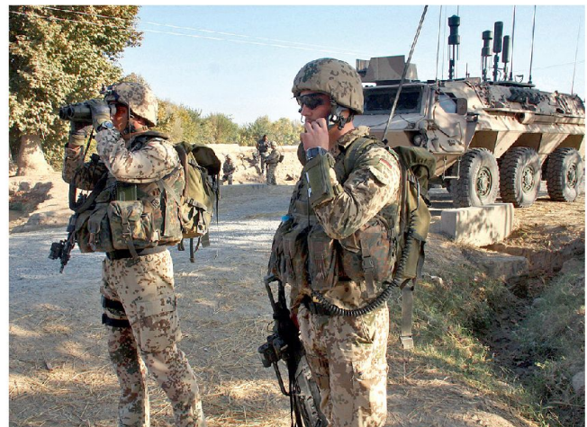
Voraussetzung ist eine lage- und bedrohungsgerechte Ausrüstung.

Im Verteidigungsministerium sind in den letzten Monaten diverse Reformmodelle ausgearbeitet worden. Zudem ist Ende Oktober 2010 der Bericht der unabhängigen Strukturkommission «Weise» präsentiert worden. Darin werden schwerwiegende Defizite im Verteidigungsministerium und bei der heutigen Bundeswehr aufgezeigt. Verlangt werden auch hier umfassende Veränderungen in der Verteidigungsorganisation und mehr Flexibilität und höhere Effizienz in der Bundeswehr selber. Die neue Situation verlangt nach Einsatzfähigkeit, ohne die möglichen Einsatz-