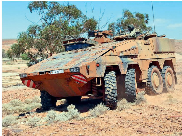
Trsp. Panzer «Boxer» (Bild) und Spz. «Puma» bilden Rückgrat der infanteriestarken Brigaden.

Die Marine soll auf noch rund 15 000 Soldaten reduziert werden, wobei fünf Fregatten und etwa 30 Boote ausser Dienst gestellt werden sollen. Dadurch würde allerdings der Einsatzwert und die Durchhaltefähigkeit stark eingeschränkt, was gemäss Militärexperten wegen der zuneh-