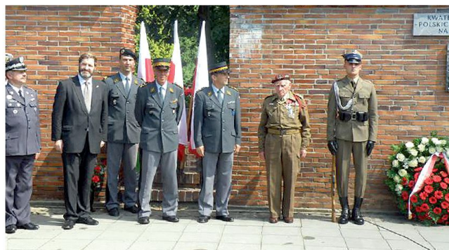
Die Schweizerdelegation im Militärfriedhof in Warschau.

en-, Ausbildungs- und Berufschullager eingerichtet und die Soldaten für die Heimkehr nach Kriegsende vorbereitet. Nahezu 900 Soldaten haben in den Hochschullagern studiert, über 300 von ihnen erwarben ein Hochschuldiplom und über 60 ein Doktorat.