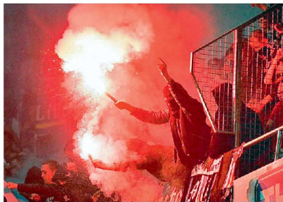
Wenn Eigennutz die Individuen der Masse aufpeitscht – Sportveranstaltung um 2000.

In der Folge melden sich ideologisch indoktrinierte Wissenschaftler, die angeblich moralisch verwerfliche Analogien zwischen dem demokratisch Autoritären und dem diktatorisch Autoritären herausfiltern und diese Analogien, losgelöst vom notwendigen Zusammenhang, für