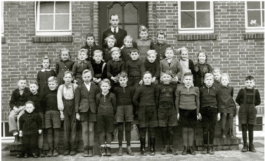
Schule um 1950 – Stärke in der Einfachheit.

Am 30. März 1985 meldet die «Tribune de Genève», wie sich der damalige Verteidigungsminister genötigt sah, Guisan zu rechtfertigen: «Chevallaz défend Guisan.» «24Heures» berichtet in diesem Zusammenhang: «La personnalité du général Henri Guisan fait l'objet d'une série de controverses» (9.4.1985). Unermüdlich versuchen plötzlich gewisse Historiker, gesellschaftlich neuorientiert und von völlig anderem Standort aus, Guisans Leistungen in Misskredit zu ziehen. Die «Basler Zeitung» lästert in kaum mehr zu überbietendem Boulevardjournalismus, aber gestützt von Professoren, mit der populistischen Suggestivfrage, ob Guisan