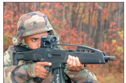
Versuche mit Sturmgewehr XM8 bei der US Army.

besten abgeschnitten haben. Diese Schiessversuche fanden in der von der US Army betriebenen Versuchseinrichtung Aberdeen Proving Ground in Maryland statt, wobei vor allem der Waffeneinsatz unter extremen Umweltbedingungen getestet wurde. Denn Erfahrungen sollen aufgezeigt haben, dass beim amerikani-