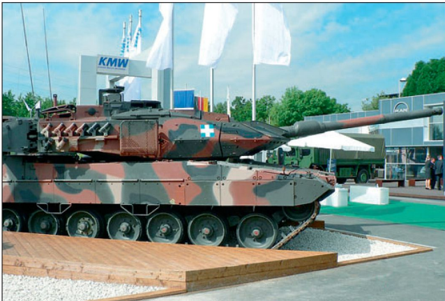
Modernisierter Kampfpanzer «Leopard 2 A6 HEL».