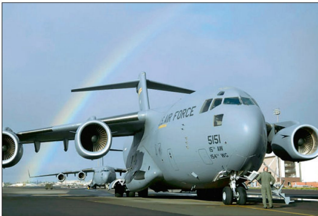
Transportflugzeug C-17 «Globemaster III».

Unterdessen haben auch US-Politiker Stellung bezogen und verlangen eine seriöse Abklärung. Mit umfassenden Untersuchungen und Vergleichsschiessen soll gewährleistet werden, dass die amerikanischen Soldaten künftig mit den besten und zuverlässigsten Waffen ausgerüstet werden.