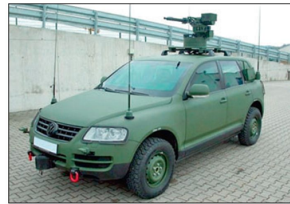
Militärversion des «Touareg».

VW und 20 «Dingo 2» beschafft worden. Für den nächsten Schritt sind 150 Fahrzeuge in der «Dingo»-Klasse ausgeschrieben worden. Darüber hinaus werden 170 kleinere geschützte Fahrzeuge in der «Eagle»-Klasse und 60 grössere 6x6 oder 8x8 Radfahrzeuge gesucht. Dabei steht natürlich eine weitere Beschaffung von gepanzerten Radschützenpanzern «Pandur» von Steyr Spezialfahrzeuge im Vordergrund. Damit soll auch eine möglichst hohe Wertschöpfung auf Österreich konzentriert bleiben. Gemäss Aussagen der Bundesheerführung sollen künftig bei Auslandseinsätzen wenn immer möglich nur noch geschützte oder ge-