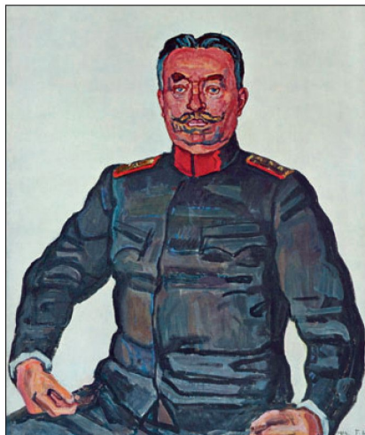
Abb. 2: Portrait General Ulrich Wille von Ferdinand Hodler.

Was die Motivation der Dienstleistenden angeht, kann die Konzeption der Inneren Führung durchaus auch für die Schweiz Vorteile bieten. Denn wie sich mit den Daten der Sicherheitsstudie 2007 12 belegen lässt, weist speziell die Alterskohorte der 18- bis 29-Jährigen – also der Dienstleistenden – gewisse Motivationsprobleme auf. 61% der Befragten wünschen sich eine Abkehr vom Milizsystem. Sie empfinden auch die Wehrpflicht als überflüssig und prägen die Einstellung: «Ja zur Armee, aber ohne mich.» Eine ethisch motivierte Führungsphilosophie kann bei Motivationsproblemen gute Dienste leisten und das Verantwort-