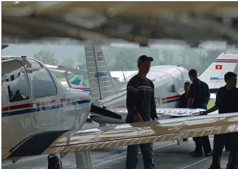
Durch Teamgeist zum Ziel im 2-wöchigen SHAIR-Kurs.