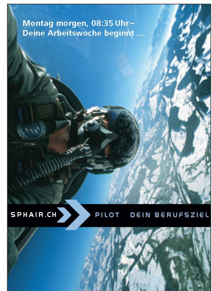
Das Cockpit eines Kampffjets: Ein Ziel von SPHAIR-Kandidaten.