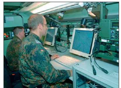
Bis 2012 sollen alle Einheiten des Heeres mit dem FüInfoSys ausgerüstet sein.

Grundsätzlich hat das FüInfoSysH zum Ziel, der militärischen Führung raschere und präzisere Informationen bereitzustellen, um so die Führungsprozesse wirksam zu unterstützen und die Informationsflüsse zu beschleunigen. FüInfoSysH ist auf Interoperabilität ausgerichtet, sowohl mit den Bündnispartnern als auch im Systemverbund mit den Teilstreitkräften der Bundeswehr. Gemäss Planung soll die Funktionalität des Systems zukünftig allen Truppengattungen des Heeres mit entsprechenden Erweiterungen und Anpassungen zur Verfügung gestellt werden. In einem weiteren Schritt wird auch eine Integration in das teilstreitkräfteübergreifende FüInfoSysSK angestrebt. Dieses befindet sich seit einigen Jahren in Entwicklung.