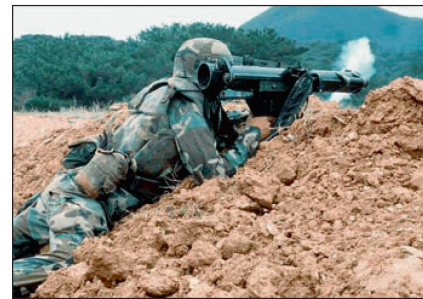
Schultergestützte Unterstützungswaffe «SMAW».

tion» handelt, für die bisher kein Verbot bestehe.