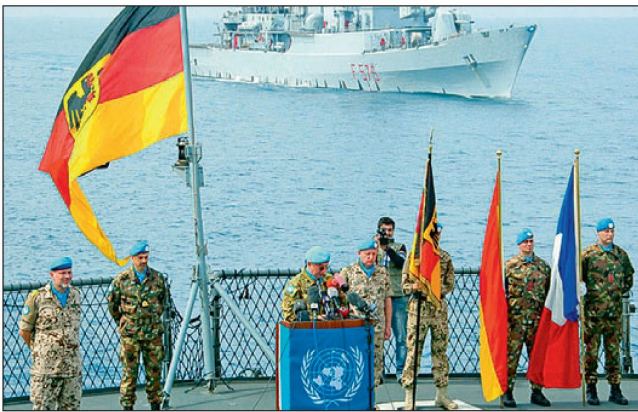
Deutsche Schiffe unterstützen auch weiterhin die UNIFIL.

Seit März 2008 ist nun die «European Maritime Force» (EUOMARFOR) – eine multinationale Einheit, die im Wesentlichen aus französischen, spanischen, italienischen und portugiesischen Truppen besteht, für die Seeüberwachung innerhalb der UNIFIL zuständig. Für rund ein Jahr wird Italien die Führungsverantwortung innehaben, später dürfte Frankreich oder Spanien das Kommando übernehmen. Aber auch deutsche Marinekräfte werden sich weiterhin substantiell an dieser Operation mit einer Fregatte, zwei Booten und einer Versorgungseinheit beteiligen. Daneben wird Deutschland seine bilateral vereinbarte materielle Unterstützung und Ausbildung der libanesischen Streitkräfte fortsetzen. Die Bundeswehr hat bisher über 300 libanesischen Soldaten in den Bereichen Operationsdienst und Logistik ausgebildet. Zudem werden libanesischen Ausbilder an Bundesweherschulen in Deutschland geschult. Der Libanon soll dadurch möglichst schnell in die Lage versetzt werden, die seeseitige Grenze gegen illegalen Waffenschmuggel selber zu sichern und so die staatliche Autorität in eigener Verantwortung wieder wahrzunehmen.