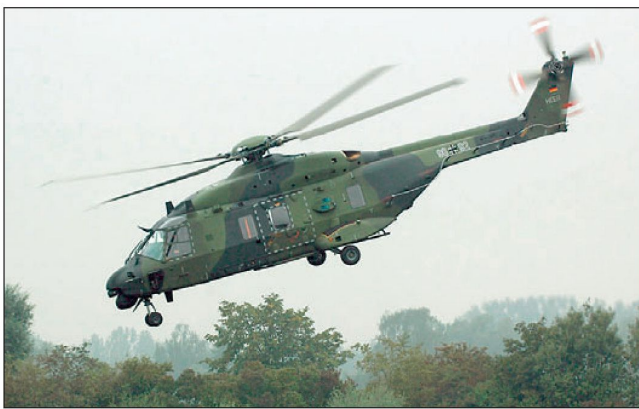
Transporthelikopter NH90 wird bei diversen Armeen eingeführt.

Frankreich, Italien und Niederlande aufgelegt; später stiessen auch Portugal und Belgien hinzu. Ausserdem haben inzwischen die Armeen von Schweden, Finnland, Norwegen, Griechenland, Spanien sowie von Oman und Australien den NH90 bestellt. Unterdessen besteht ein fester Auftragsbestand für 507 Maschinen unterschiedlicher Versionen. Allgemein wird in nächster Zeit mit weiteren Bestellungen gerechnet.