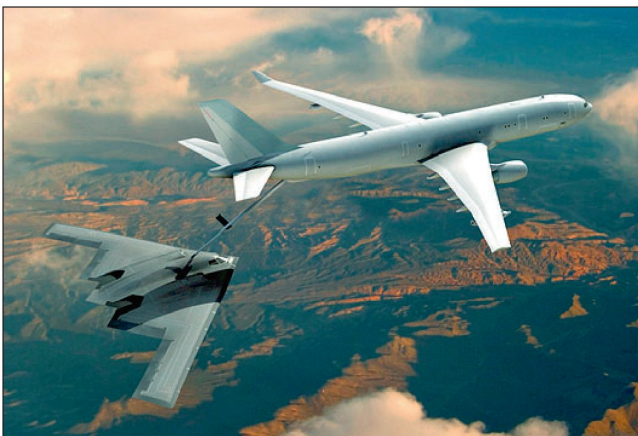
Tankflugzeug KC-30 betankt einen B2-Bomber.

Die Entscheidung für Tankflugzeuge vom Typ KC-45A hat die US Air Force nach einem mehrjährigen Auswahlverfahren Ende Februar 2008 gefällt. Der Auftrag umfasst insgesamt 179 Flugzeuge und hat ein Gesamtvolumen von rund 40 Mrd. US Dollar. Dieser jüngste Erfolg einer Reihe von Wettbewerben bestätigt einmal mehr die hohe Konkurrenzfähigkeit des EADS-Tankers auf dem internationalen Flugzeugmarkt. Neben den australischen Luftstreitkräften haben bisher auch Saudi-Arabien und die Vereinigten Arabischen Emirate Tankflugzeuge vom Typ A330 MRTT in Auftrag gegeben. Zudem wird noch in