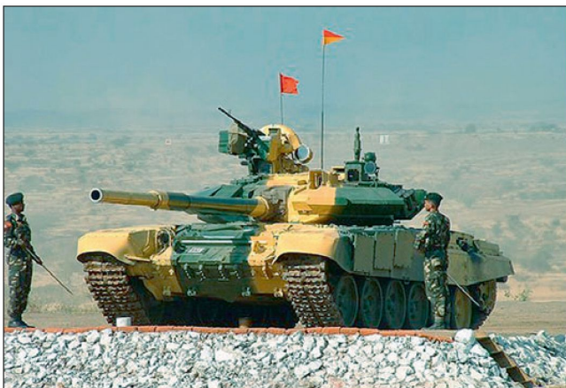
Lieferung von Kampfpanzern T-90S an Indien.