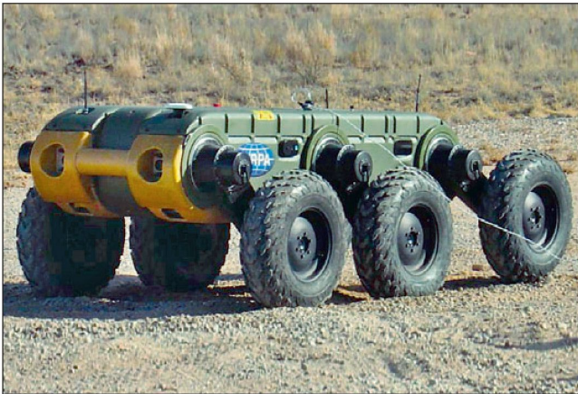
Das UGV «MULE» ist ein Element der FCS.

gramme führen. Die Einführung und Nutzung von UGV's dürfte daher zusammen mit den Komponenten der FCS erst ab 2020 in größerem Umfang erfolgen.