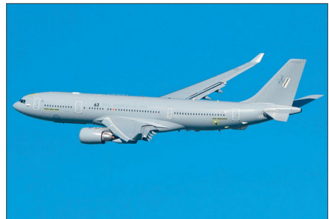
A330 MRTT der australischen Streitkräfte.

Mit dem neuen Tankerflugzeug A330 MRTT können bei Verlegungen in der Luft nicht nur Kampfflugzeuge aufgetankt, sondern auch gleichzeitig die erforderlichen Techniker und das Bodenpersonal sowie Ersatzteile mitgeführt werden. Vorauskommandos an Zwischenlandeplätzen entfallen damit. Ohne grössere Umbauten ist das gleiche Flugzeug in der Lage, für den Rückflug wiederum als Transportflugzeug für Personal und Material eingesetzt zu werden. Über «Refueling Pods» unter den Tragflächen