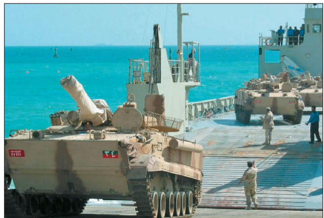
Kampfschützenpanzer BMP-3 in der Armee der VAE.