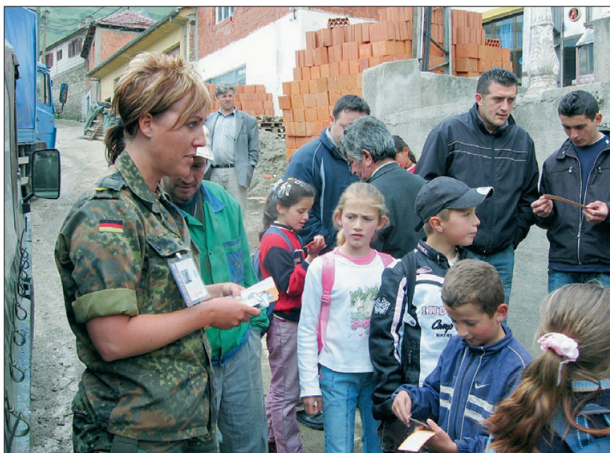
Abb. 7: Zielgruppenanalyse beim Pre-Test eines Produkts.

In einer globalisierten Medienwelt wird der Kampf um die Köpfe der Menschen bei Konflikten immer wichtiger, aber auch immer schwieriger. Auch die Schweiz kann sich dieser Entwicklung nicht entziehen.