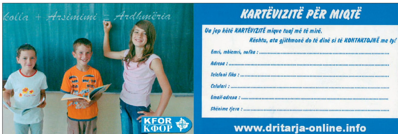
Abb. 8: Freundschaftskarte – ein PSYOPS-Produkt mit Kernbotschaft.

Im Unterschied zur «weissen PSYOPS» verheimlicht «graue PSYOPS» Absender und Autor. «Schwarze PSYOPS» dagegen lügt nicht nur zur Erreichung ihrer Informationsziele, sondern fälscht bewusst auch Absender und Autor. Im Rahmen von «Kampfpsyops» kann es durchaus zur Anwendung von schwarzer PSYOPS kommen. Die Fallhöhe ist aber gross, wenn der Lügner ertappt wird. Besonders dann, wenn dies, wie heutzutage üblich, in einem globalisierten, vernetzten Mediuumfeld geschieht.