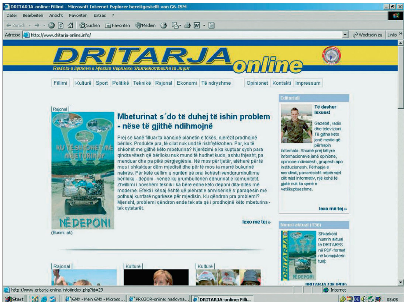
Abb. 6: Dank der Unterstützung der Heimredaktion möglich: Internetauftritt – Beitrag zum Medienmix zur Erhöhung der Durchschlagskraft der Botschaften.

Die deutsche Operative Information arbeitet nach dem Prinzip von «weisser PSYOPS». Die Artikel in der «Dritarja» sind gezeichnet. So tritt die Multinationale Task Force South oder KFOR immer als Autor und Herausgeber auf. Im Rahmen von Frieden bewahrenden und konsolidierenden Operationen ist alles andere als «weisse PSYOPS» ein kaum zu verantwortendes Risiko. Nicht lügen heisst in diesem Zusammenhang ja auch nicht, dass immer alles gesagt werden muss.