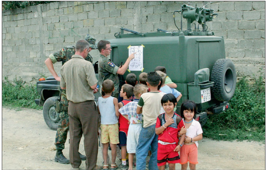
Abb. 3: Taktisches PSYOPS-Team bei der Gesprächsaufklärung und Zielgruppenanalyse.

Die PSYOPS-Abteilung ist Teil des Führungsgrundgebietes Operationen (FGG 3) eines Stabs. Der direkte Vorgesetzte ist also der Chef dieses Führungsgrundgebietes (C FGG 3) der Task Force.