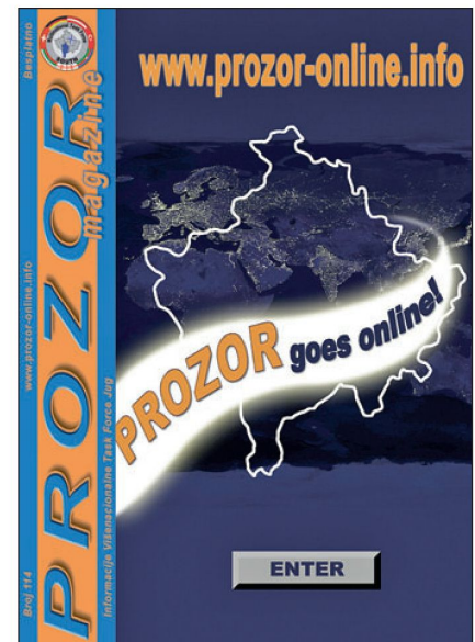
Abb. 2: Produkt der Printabteilung, alle 14 Tage: PROZOR-Hochglanzmagazin in Serbisch.

PSYOPS-Abteilung des Hauptquartiers (HQ).