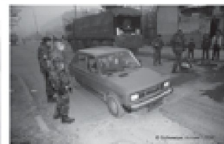
Drei Armeeaufträge aus militäretischer Sicht.