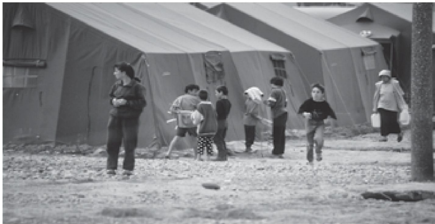
Zivil-militärische Zusammenarbeit als wichtiger Teil von militärischen Operationen.

Dies einerseits, weil der finanzielle und logistische Aufwand, neben den Armeen parallel noch eine hohe Anzahl permanenter ziviler Rettungskräfte für ausserordentliche Lagen auch in ordentlichen Lagen bereitzustellen, zu hoch und wenig sinnvoll wäre. Andererseits besteht bei solchen Ereignissen immer die Gefahr, dass Situationen entstehen, die das Soldatenhandwerk benötigen (z. B. Plünderungen). Der Übergang von Existenzsicherungsoperationen hin zu Raumsicherungs- bzw. Stabilisierungsoperationen ist fließend. 43