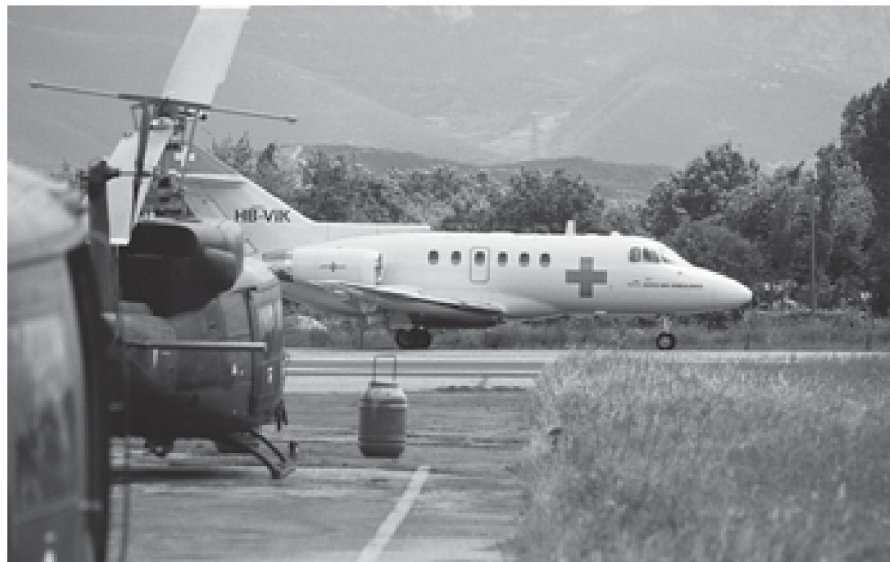
Integrierte Missionen stehen im Zentrum zukünftiger Krisenbewältigungsinstrumente.