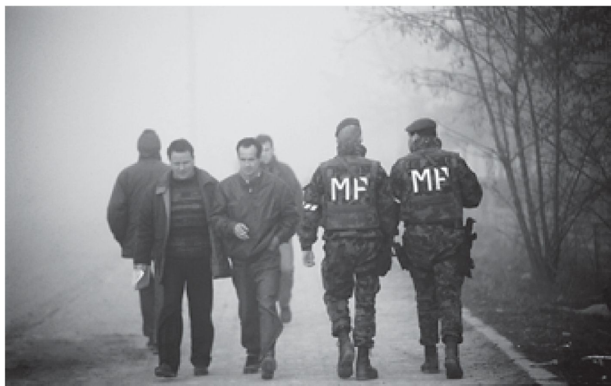
Eine bewaffnete Swissoy (MP) Patrouille im Kosovo kreuzt bei einem Kontrollgang Zivilisten.