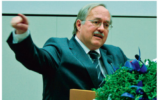
Bundesrat Samuel Schmid: Überzeugter Verfechter der Milizarmee.