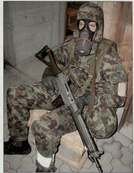
Schlafen und Wache mit Schuma.

Ausserhalb von Ilanz wartete, nach einem kurzen Marsch, das Essen auf uns. Ungekocht, versteht sich. Verschiedenes Gemüse, Maiskörner und fünf Hasen pro Klasse warteten darauf, gekocht, gebraten und frittiert zu werden. Nach einer Stunde Kochzeit war es so weit. Eine, für die meisten, unerwartet gute Mahlzeit war bereit zum Verschlingen. Unglaublich, wie diese kleine Aufgabe unser ganzes Team noch