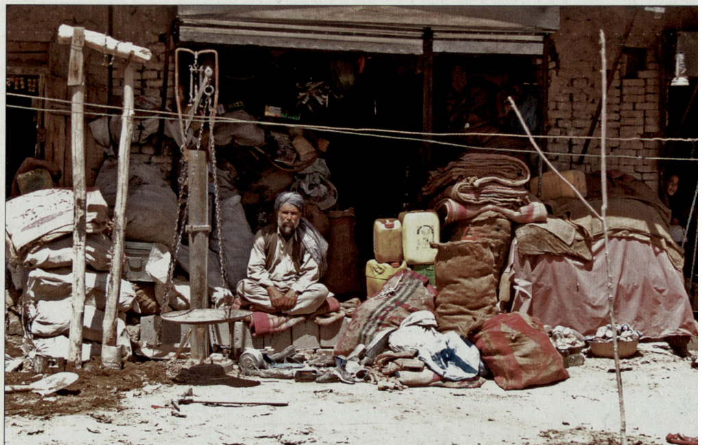
Ghazni, Afghanistan. Foto: Simone Ueberwasser ASMZ-Leserreise 2005