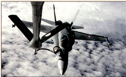
Luftbetankung eines F/A-18 der Schweizer Luftwaffe durch ein französisches KC-10-Tankerflugzeug.

Diese Erkenntnis ist auch in das ALB XXI und in den SIPOL B 2000 eingeflossen und verpflichtet die Armee dazu, die Interoperabilität so aufzubauen, dass sie in ihrem gesamten Einsatzspektrum sowohl zur Zusammenarbeit mit zivilen Partnern im Inland als auch zur Kooperation mit ausgewählten Partnern im Ausland befähigt ist.