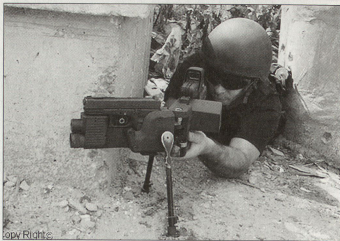
Soldaten sind mit «Corner Shot» in der Lage, um die Ecke zu schießen.

Mit dieser Waffe können feindliche Kampffahrzeuge bekämpft werden, ohne dass sich der Schütze aus der Deckung wagen muss. Grundsätzlich kann das «Corner Shot»-Gerät aber auch für einen geschützten Einsatz anderer Infanteriewaffen (Sturmgewehr M-16 usw.) verwendet werden. Mit «Corner Shot» werden die Schützen von Panzerfausten oder anderen Waffen in die Lage versetzt, über ein eingebautes Kamerasys-