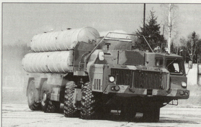
Abschussfahrzeug des russischen Flab- und Flugkörperabwehrsystems S-300 PMU-2 «Favorit».