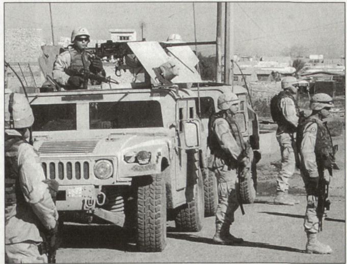
Aufklärungsfahrzeug «Hummer» mit improvisierten Schutzverbesserungen beim Einsatz im Irak.

Die modular aufgebaute Zusatzpanzerung kann bei Bedarf relativ rasch auch unter Feldbedingungen aufgebaut werden, zerstörte Teile sollen jederzeit ersetzbar sein. Vorgesehen ist im Weiteren die Integration einer fernbedienbaren Waffenstation, die unter Gefechtsbedingungen jederzeit eine gesicherte Beobachtung sowie einen geschützten Waffeneinsatz ermöglicht. D.E.