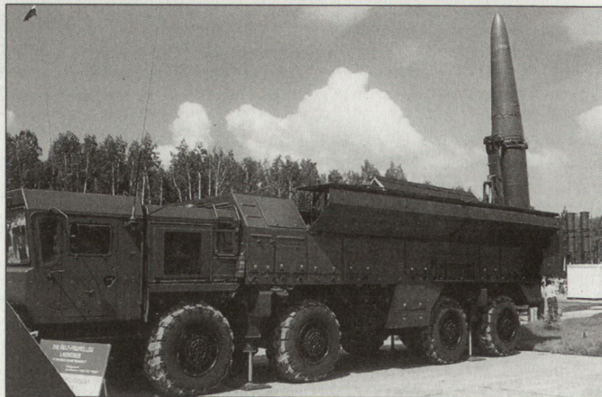
Die Lieferung des neuen mobilen Lenkwaffensystems SS-26 «Tender» soll in nächster Zeit beginnen.

lich 2000 Soldaten vorübergehend in den Kosovo verlegt worden. Die KFOR wurde in dieser Zeit auf einen Bestand von gegen 20000 Personen erhöht. Die zusätzlichen Truppen kamen primär aus Deutschland, Italien und Frankreich. Unterdessen sind diese Kräfte wieder abgezogen worden; bis Ende Jahr soll der KFOR-Bestand auf rund 17000 Soldaten reduziert werden. hg