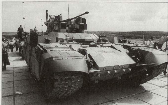
BMPT, das neue gepanzerte Transportfahrzeug für die russische Infanterie und für die Spezialtruppen.

die übergeordneten Radargeräte sowie die mobilen Kommandoeinrichtungen. Gemäss russischen Angaben verfügt das auch für China vorgesehene verbesserte Radargerät 64N6E2 über eine Erfassungsreichweite von 300 km. Die Bekämpfung von Luftzielen soll bis auf eine maximale Distanz von 200 km möglich sein. Ballistische Ziele können bis maximal 40 km und eine Einsatzhöhe von 27 km bekämpft werden. Die chinesischen Streitkräfte haben bereits Mitte der 90er-Jahre von Russland Flabsysteme der Typen S-300PMU und S-300PMU-1 beschafft, die unterdessen in das chinesische Luftverteidigungssystem integriert sein sollen. Beim aktuellen Liefervertrag handelt es sich bereits um den vierten Kaufabschluss für Komponenten des Luftverteidigungssystems S-300PMU. Bisher waren die staatlichen russischen Exportverantwortlichen bezüglich Export der verbesserten Version S-300PMU-2 sehr zurückhaltend. Hersteller dieser Systeme ist die russische Rüstungsfirma Antey. hg