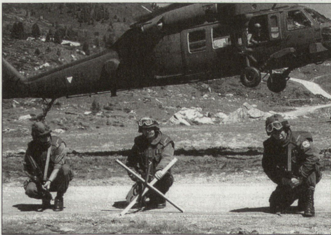
Einfliegen von Spezialtruppen mit Helikopter «Black Hawk».

Vorgesehen für solche Einsätze sind heute Teile des Jägerbataillons 25, das u. a. auch über eine Kompanie mit Fallschirmspringerausbildung verfügt. Das Bataillon besteht aus einer Stabskompanie, zwei Jägerkompanien, einer so genannten Kaderkompanie und einer schweren Kompanie. Insbesondere die dritte Jägerkompanie (Kaderkompanie) ist für Spezialaufgaben vorgesehen und verfügt über entsprechende Mittel und Ausbildung. Gegenwärtig werden die einzelnen Einheiten auf die vorgesehenen Aufgaben vorbereitet. Vorderhand sind aber bezüglich Einsatzfähigkeit der österreichischen Spezialeinsatzkräfte noch Grenzen gesetzt. Mängel bestehen insbesondere in den Bereichen Führung und Übermittlung sowie bei der Logistik. Autonome Einsätze im Ausland dürften deshalb bis auf weiteres nur sehr begrenzt durchführbar sein. Es zeichnet sich aber ab, dass im Rahmen der neuen Bundesheerreform 2010 dem Ausbau der Spezialeinsatzkräfte hohe Priorität beigemessen wird. hg