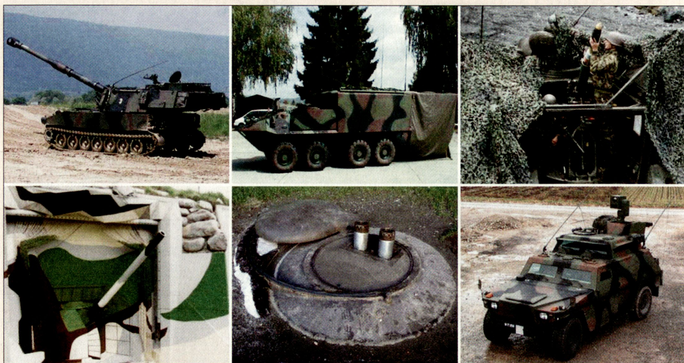
Wichtige Systeme im Lehrverband Artillerie: Kampfwertgesteigerte Panzerhaubitze M-109, Führungsfahrzeug Piranha IIIC, Panzerminenwerfer M-113, Festungskanone BISON, Festungsminenwerfer und Schiesskommandantenfahrzeug (v. l. n. r.).

Grundsätzlich geht es um die Sicherstellung der Ausbildung der taktischen Einheit in der Grundausbildung und um das Erstellen bzw. um das Überprüfen der Grundbereitschaft der Abteilungen und Einheiten. Was bezüglich artilleristischem Können in der A 61 erreicht und in der A 95 leider verloren ging, muss mit der neuen Armee wieder erarbeitet werden. Für eine glaubhafte und sichere Feuerunterstützung dürfen wir uns in der Ausbildung und Führung keine Halbheiten erlauben. Dabei sind aber auch die Miliz und vorab die Kader gefordert.