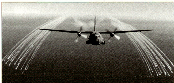
Ablenken IR-gelenkter Flugkörper mittels Leuchtkörpern (Flares) bei einer «Transall».

Der neue verbesserte Selbstschutz zeigt über eine Radarwarnanlage die Erfassung durch Zielsuch- und Zielverfolgungsradar an und warnt die Besatzung vor anfliegenden Lenk Waffen (mittels Flugkörperwarnanlage). Auf die jeweils angezeigte Bedrohung kann sofort mit Gegenmassnahmen wie das Stören des gegner-