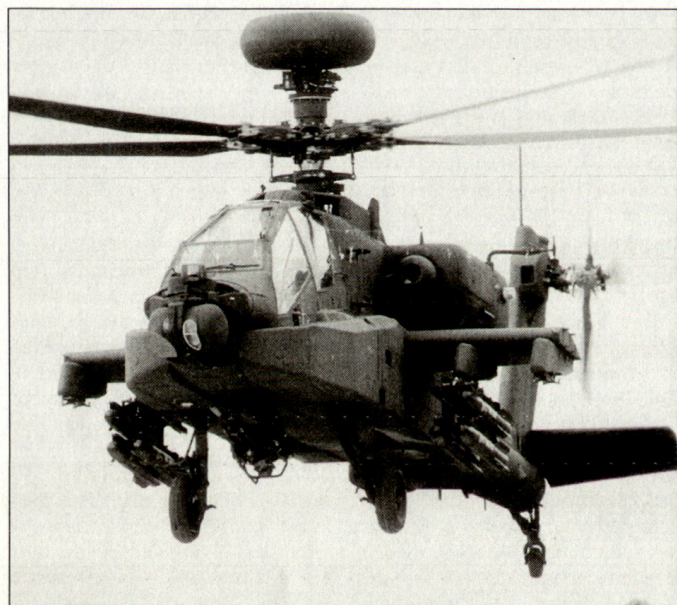
Kampfhelikopter AH-64D «Apache» mit Radar «Longbow».

Wie der Irakkrieg gezeigt hat, sind bei der neuen Taktik der Nahunterstützung durch Kampfhelikopter noch Anpassungen notwendig; insbesondere resultieren veränderte Anforderungen an die Fliegereinsatzleitung. Deren koordinierende Massnahmen müssen