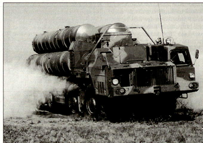
Mobile Abschusscontainer des kombinierten Flab- und Raketenabwehrsystems S-300 PMU.

Der militär-industrielle Komplex Russlands hofft aber auch weiterhin auf Verkaufsmöglichkeiten für die operativen Flab-Lenk Waffen der Typen S-300 und S-400. hg