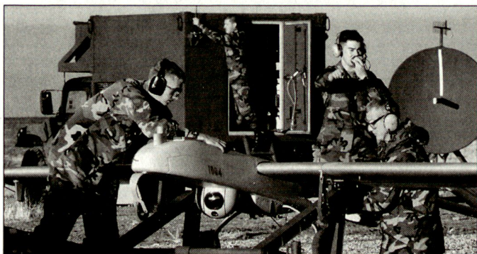
Taktisches Aufklärungssystem «Shadow» bei der US-Army.

punkt des Einsatzes von Kampfhelikoptern mehrheitlich bei Angriffen gegen Truppenkonzentrationen und Unterstützungswaffen in der Tiefe des Gefechtsfeldes. Während diese Fähigkeit auch weiterhin bewahrt werden soll, kommt nun mit der direkten Feuerunterstützung für Brigadekampfruppen eine neue Aufgabe