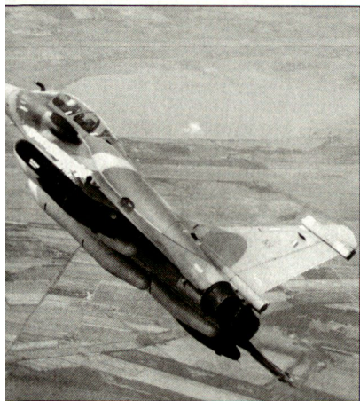
Die ersten Kampfflugzeuge «Rafale» sollen 2004 den französischen Luftstreitkräften zugeführt werden.