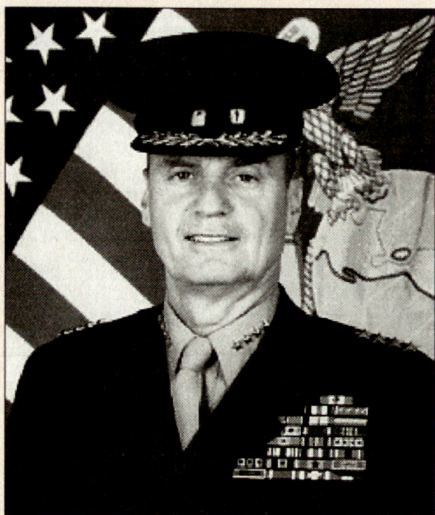
General James Jones, der NATO-Oberbefehlshaber in Europa.

Zu Beginn der «heissen» Übungsphase erhielt der Kommandant der GFOR den