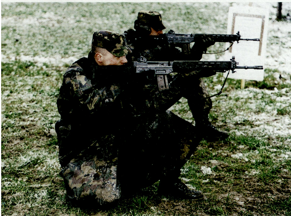
Ausbildung im Feld.

■ Führungstätigkeiten und Führungstechniken;