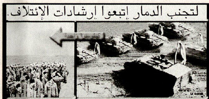
Das amerikanische Flugblatt gibt Anweisungen, wie sich ein mechanisierter Verband zu ergeben hat. Die Truppe muss sich einen Kilometer entfernt von den Panzern aufstellen.

Ein amerikanisches Flugblatt forderte die Empfänger auf, abgeschossenen alliierten Fliegern zu helfen: «Helft den Piloten, zu ihren Familien zurückzukehren. Gebt ihnen zu essen und zu trinken. Verarztet sie, wo nötig. Gebt freies Geleit und zeigt den Weg. Ihr werdet dafür reich belohnt.» Umgekehrt setzte das irakische Regime beträchtliche Kopfgelder und Prämien aus: