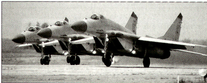
Neues russisches Angebot für Kampfflugzeuge MiG-29M.

Bundeskanzler Schüssel hat unterdessen bekannt gegeben, dass am Entscheid zum Kauf des Eurofighter «Typhoon» festgehalten werde. Weiterhin unklar ist aber deren Finanzierung. Die noch im letzten Jahr angeregte Idee, den Ankauf der Abfangjäger von einer Wirtschaftsplattform finanzieren zu lassen, konnte bisher nicht verwirklicht werden. Auch eine Erhöhung des Verteidigungsbudgets lässt sich gegenwärtig in Österreich aus politischen Gründen kaum verwirklichen. hg