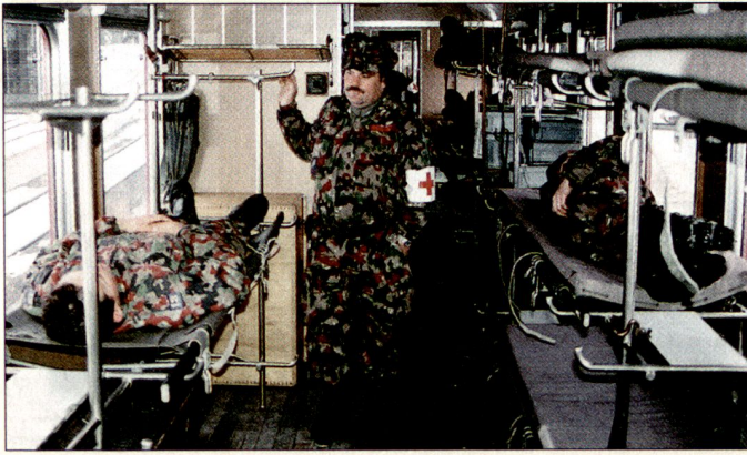
San Eisz Zug IV und V/13 (B): Inneres eines Wagens für den Transport von liegenden Patienten auf Tragbahnen in Bergün (November 1996).