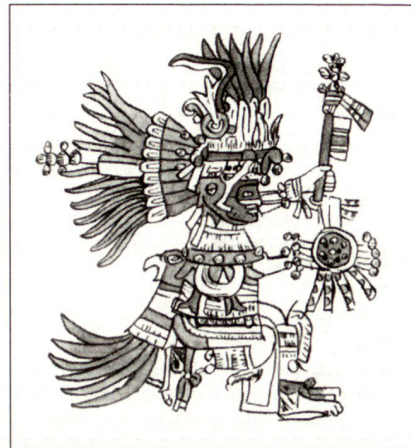
Huitzilopochtli, die aztekische Hauptgottheit (nach Codex Telleriano-Remensis).

What is often forgotten is the brevity of the Aztec empire. Tenochtitlan was founded in 1325 by a tribe that had migrated from the mythical city of Aztlan in northwest Mexico. Yet within a century, the Aztecs had colonized all of central Mexico and gone as far south as today's El Salvador. By then, the empire had a single ruler, but it operated as a theocracy subject to the whims of an array of deities, mainly Huitzilopochtli, the god of war, and Tlaloc, the god of water, whose shrines stood atop the Templo Mayor, or