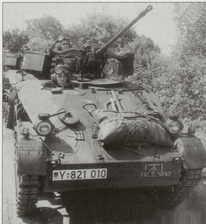
Teile der deutschen Luftlandebrigade 31 stehen in Afghanistan im Einsatz (Bild: Leichter Luftlandpanzer «Wiesel»).

2. Die Versorgungslage ist nur schwierig zu gewährleisten. Deutschland verfügt nicht über die Lufttransportkapazität, um ohne fremde Hilfe den Ersttransport durchführen zu können. Allein die 230 Soldaten des Vorkommandos benötigen 86 Fahrzeuge, darunter Jeeps, Lastwagen, gepanzerte und minengeschützte Einsatzfahrzeuge des Typs «Dingo» sowie vier leicht gepanzerte Luftlandpanzer «Wiesel». Hinzu kommen Führungsmittel, Funkausrüstung, Sanitätsmaterial, Feldküchen, Minenräumgerät sowie alle Versorgungsgüter, weil aus dem Lande nichts zu besorgen ist. Die Truppe hängt völlig an der Versorgungspipeline aus Deutschland. Die Bundeswehr muss sich für den Direkttransport und die Versorgung Transportflugzeuge aus dem Ausland anmieten, denn nur diese können eine Entfernung von über 5000 km ohne Stopp überwinden. Das Nadelöhr ist der 40 km von Kabul entfernt liegende Flugplatz Bagram. Er ist unter US-Kontrolle und kann aus Sicherheitsgründen nur nachts angefliegen werden. Der Flughafen «Kabul International» ist schwer beschädigt und noch nicht voll einsatzfähig. Tp.