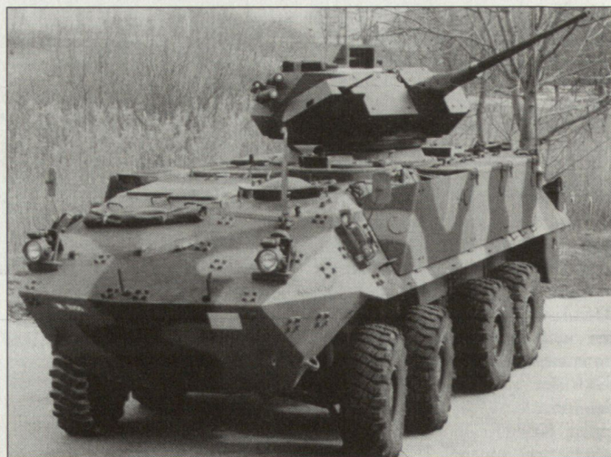
Schützenpanzer «Piranha III» für Polen?

Die polnische Armee will mit den neuen Radschützenpanzern so rasch als möglich ein mechanisiertes Infanteriebataillon bilden, das auch im NATO-Rahmen für Auslandseinsätze eingesetzt werden kann. Noch ist unklar, wieviele Fahrzeuge schlussendlich beschafft werden können. hg