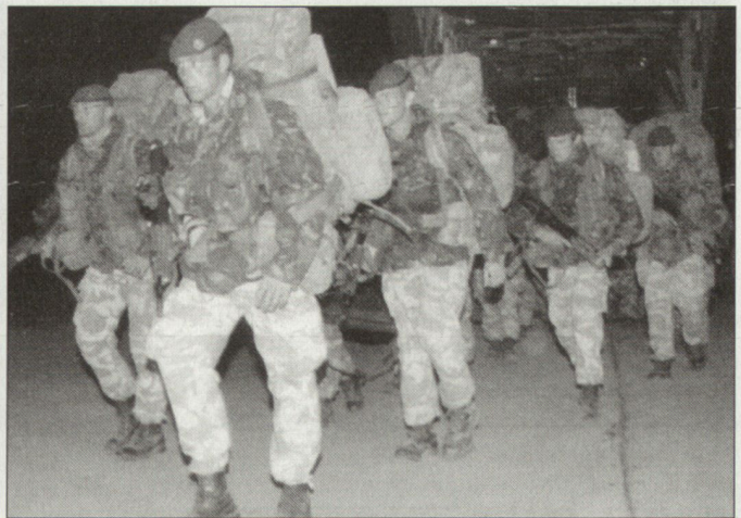
Britische Truppen der JRRF auf dem Flughafen Bagram in Afghanistan.

Die JRRF umfasst einen Pool der aus den besten Kampf- und Unterstützungstruppen besteht; darunter befinden sich auch die Spezialtruppen. Geplant ist, dass künftig die Verlegung dieser Kräfte mit den neuen Transportschiffen (in Beschaffung) oder mit den geleasten Transportflugzeugen C-17 gewährleistet werden kann. Ab zirka 2007 sollen dann die neuen Transportflugzeuge A400M, von denen Grossbritannien 25 Stück bestellt hat, zur Verfügung stehen (siehe auch ASMZ Nr. 10/2001, Seite 47). hg