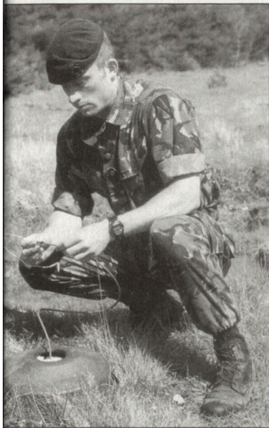
Zur Sicherung der Lage in und um Kabul sind vor allem auch Minenspezialisten gefragt. (Bild: britischer Spezialist der Marines bei der Minenausbildung).