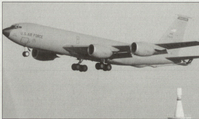
Bei ihrem Kampf gegen den Terrorismus stehen der NATO auch Flugbasen in Zentralasien zur Verfügung (Bild: Tankerflugzeug KC-135R der USAF).

Taschikistan hat bereits frühzeitig den Flughafen Kuljab auch für Militärflugzeuge der NATO-Mitgliedstaaten zur Verfügung gestellt. Dies sowohl im Zusammenhang mit der Operation «Enduring Freedom» als auch für Transportmaschinen zu Gunsten der ISAF. Auch die Führung Kirgisiens sowie Usbekistans stellen Teile ihrer Infrastruktur, inkl. Flugplätze, den Truppen der Allianz zur Verfügung.