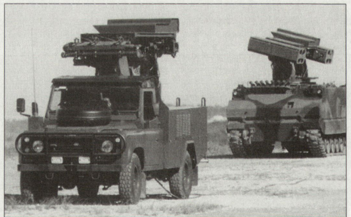
Unter der Wirtschaftskrise leidet auch die eigene türkische Rüstungsindustrie. Bild: Prototypen neuer Flab-Systeme.

Weitere Kürzungen und Verzögerungen sind auch bei der türkischen Luftwaffe absehbar. Die reduzierte Anzahl von 50 Kampfhelikoptern AH-1Z «King Cobra» dürfte mit Verzögerung eingeführt werden. Die geplante Zahl von Frühwarnflugzeugen des Typs E-737, die im Jahre 2001 von ursprünglich acht auf noch vier