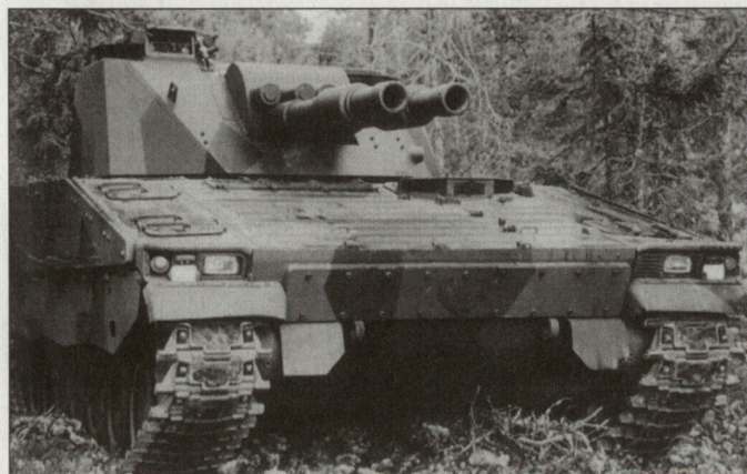
Zwillingsminenwerfer «AMOS» auf Schützenpanzer CV-90.

automatischen, hydro-pneumatischen Lader ausgerüstet. Mitgeführt werden können 84 Schuss HE und sechs endphasengelenkte Munition vom Typ «Stryx». Die Feuergeschwindigkeit beträgt 26 Schuss/Min., wobei die ersten vier in weniger als 8 Sekunden abgegeben werden können. Als Reichweite werden mehr als 10 km angegeben. Vom Feuerunterstützungsmittel «AMOS» existieren bereits diverse Prototypen auf unterschiedlichen Fahrgestellen; bisher primär auf der Basis von Radschützenpanzern. hg