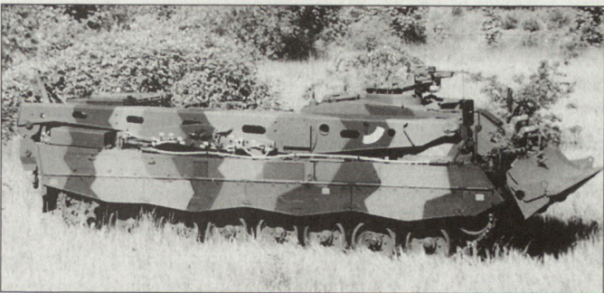
Bergepanzer auf Chassis «Leopard 2».

zösischen Bergepanzer «Leclerc» als auch an den südkoreanischen K1 angepasst. Der schwedische Bergepanzer verfügt gegenüber dem «Büffel» über einen verbesserten ballistischen Schutz einschließlich eines integrierten Splitterschutzes, eine reduzierte IR-Signatur, ein Führungs- und Navigationssystem, eine Waffenstation und über Nebelwerfer zur Selbstverteidigung. Ausserdem wurde ein Bergesystem unter Panzerschutz mit rückwärtigen Kameras integriert. Der Arbeitsbereich der Krananlage wird durch eine 1,5-t-Hilfswinde sowie mit der Leistungsfähigkeit des Dreifachzuges mit der Hauptwindenanlage (35 t Einfachzug) erhöht. Ausser Schweden haben auch die Schweiz und Spanien Verträge über insgesamt mehr als 40 Bergepanzer dieses Typs abgeschlossen. hg