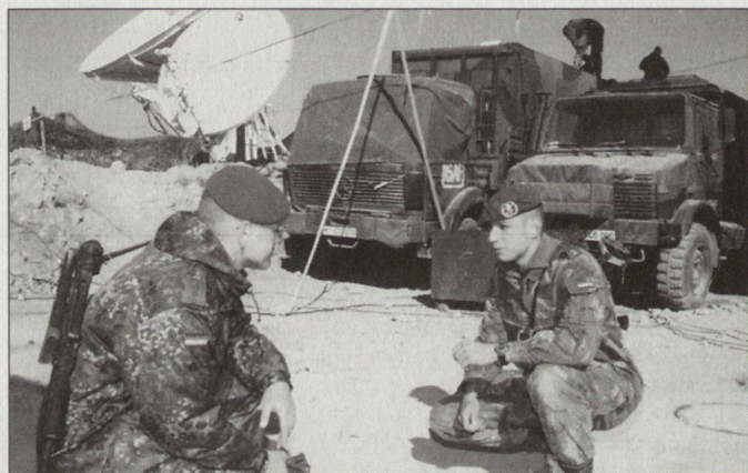
Deutsche Truppen der ISAF in der Region Kabul.

den Friedenstruppe durch die Türkei wahrgenommen. Das seit Juni 2002 laufende Mandat für das türkische Kommando läuft offiziell Ende dieses Jahres aus, es muss angenommen werden, dass eine Verlängerung bis Februar 2003 angestrebt wird. Der Entscheid zugunsten der deutschen Bundeswehr, die auf die Unterstützung der Niederlande angewiesen ist, soll auf Druck der USA und