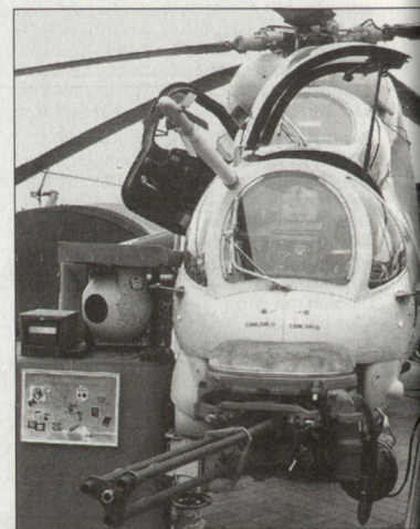
Beispiel eines modernisierten Kampfhelis Mi-24 an der polnischen Rüstungsmesse in Kielce.

Gemäss vorliegenden Planungen sollen die Kosten für die Modernisierung pro Helikopter rund 4 Mio. US$ kosten; mit der Umrüstung soll frühestens 2005 begonnen werden. Die verbesserten Kampfhelikopter Mi-24 sollen anschliessend bis etwa 2020 im Dienst verbleiben. hg