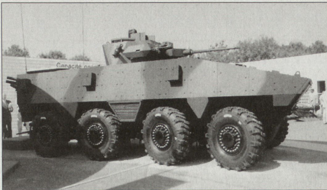
Modell des Schützenpanzers VBCI.

fechtsfahrzeuge für die Infanterie und 150 Führungs- und Gefechtsstandfahrzeuge. Die Rüstungswerke Giat sind für Schutz, Turmkonstruktion mit 25-mm-Automatenkanone, Beobachtungs- und Führungsfunktionen sowie die Gesamtintegration zuständig. Die eigentliche Fahrzeugentwicklung findet in den Werken von Renault statt.