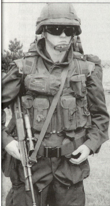
Evaluation einer neuen Kampfbekleidung für österreichische Soldaten.

Unterdessen wird der neue Kampfanzug auch durch österreichische Truppen im internationalen Einsatz (KFOR, ISAF) getestet. Dabei geht es darum, die gemachten Erfahrungen und Ergebnisse der Erprobung zu bewerten und gegebenenfalls durch Weiterentwicklungen bzw. Veränderungen und Verbesserungen umzusetzen. Nach einer definitiven Entscheidung soll ab 2003 die neue Kampfbekleidung an die Truppe abgegeben werden. hg