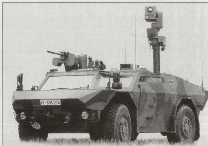
Aufklärungsfahrzeug «Fennek» mit Sensormast.

Die deutsche Bundeswehr beschafft primär die Aufklärerversion: 178 Fahrzeuge «Fennek» sind als Panzeraufklärer vorgesehen. Die Übrigen werden für andere Aufgaben eingesetzt. Gemäss vorliegenden Informationen soll die Truppeneinführung in beiden Armeen im Verlaufe des Jahres 2003 beginnen. hg