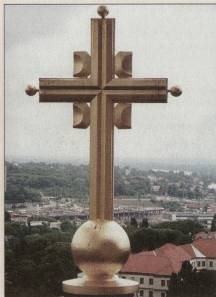
Das orthodoxe Serbien.

Neben den Altlasten von «Allied Force» ist Jugoslawien mit den Folgen des kriminellen Milosevic-Regimes und der Mafiaschichten der albanischen Mafia konfrontiert. In Anbetracht der Ausbreitung der Tentakel der albanischen Mafia können die Europäer gegenüber dieser Bedrohung nicht tatenlos bleiben, sondern müssen sie aktiv bekämpfen. ■