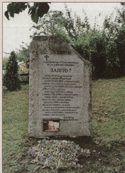
Die getöteten Journalisten.