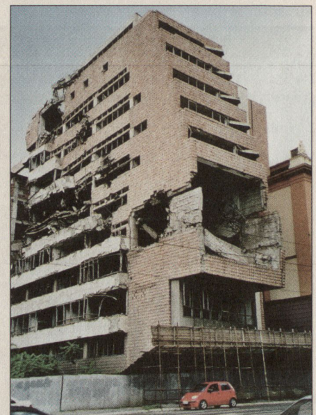
Das Hauptquartier der Streitkräfte.