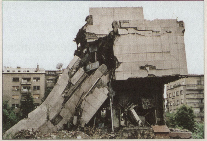
Ein Nebengebäude des Hauptquartiers.

Neben Banden aus Serbien, Albanien und dem Kosovo sind auch Kriminelle aus Bosnien-Herzegowina und Kroatien aktiv.