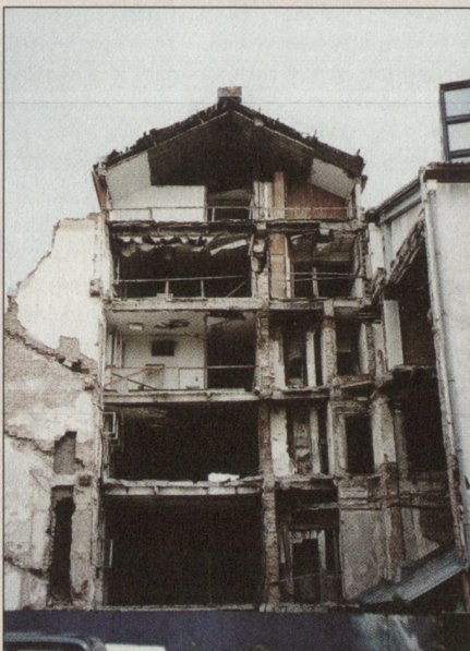
Zerstörtes Rundfunkgebäude in Belgrad.

Nach dem Ende der NATO-Operation «Allied Force» 1999 und dem Sturz von Milosevic hat eine Diversifikation der OK-Tätigkeiten auf dem Balkan und eine Verlagerung der Balkanroute stattgefunden. In Konkurrenz zur Belgrader OK stehen albanische Familiengangs, welche die Situation im Kosovo, in Mazedonien und Albanien für sich ausnützen. Neben der Belgradroute ist die Herointransitachse über Mazedonien-Kosovo(Prizren)-Albanien eröffnet worden. Die Hauptgewinner von «Allied Force» und der Vertreibung der Serben aus dem Kosovo sind die kriminellen Gangs im Kosovo. Diese albanische Mafia ist auch im Menschenhandel mit Prostituierten und Waffen tätig.