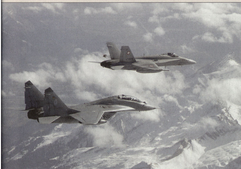
F/A-18 und MiG-29 in Patrouille.

Die FULCRUM-Kampagne in Dübendorf war sehr erfolgreich und äusserst wertvoll. Ein weiterer Schritt im optimalen Nutzen von sehr teuren Waffensystemen zur Sicherheit und Wahrung unseres Luftraumes und damit unseres Landes ist getan. ■