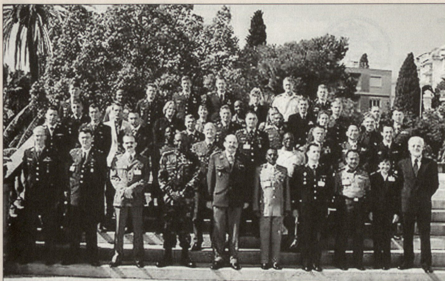
Kursleitung und Teilnehmer eines internationalen Kurses für Kriegsvölkerrecht.