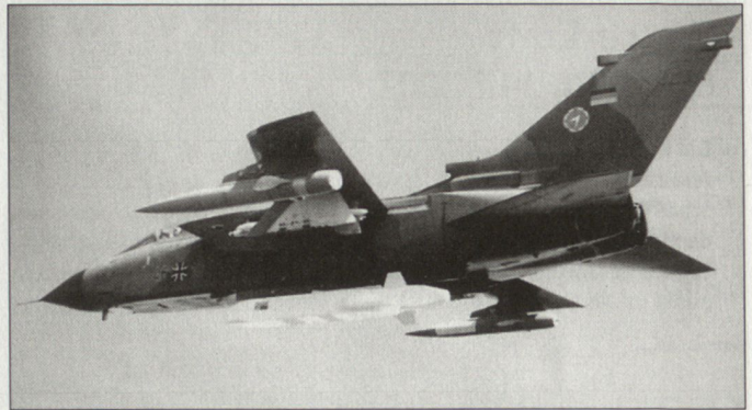
Kampfflugzeug «Tornado» mit Abstandlenkwaffe «Taurus».

Ob allerdings die Bundeswehr mit den Truppenreduzierungen auf dem Balkan neue Handlungsfreiheit gewinnt, ist zweifelhaft. Denn parallel zum laufenden Einsatz in Afghanistan und zu Gunsten der Operation «Enduring Freedom» sind auch weiterhin Kontingente für SFOR, KFOR und TFF zu stellen. hg