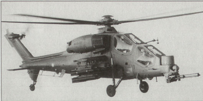
Vorgesehene Modernisierung der Kampfhelikopter A-129 «Mangusta» beim italienischen Heer.

Prozent des Bruttosozialproduktes beinahe erreicht. Ein grosser Teil der zusätzlichen Mittel muss allerdings für Personalausgaben verwendet werden. Grund dafür ist einerseits der Übergang zur Freiwilligenarmee und andererseits die zunehmenden Kosten für Auslandseinsätze. Die Löhne und Vergütungen für Soldaten im Auslandseinsatz sind massiv höher als bei Dienstleistungen in Italien. Grundsätzlich soll aber künftig der Anteil für Operationen und Investitionen auf Kosten der Verwaltung erhöht werden. Das Schwergewicht liegt weiterhin bei multinationalen Einsätzen zur Friedenssicherung (PSO).