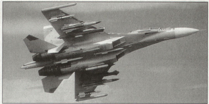
Prototyp des Kampfflugzeuges Su-30MK.

Gemäss Weisung des österreichischen Verteidigungsministers ist nach der Inkraftsetzung der Reorganisation eine zweijährige Erprobungsphase vorgesehen. Eine Evaluierung soll im Jahr 2005 erfolgen. hg