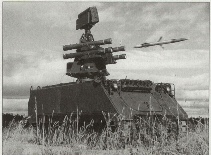
Standardversion des taktischen Flab-Systems ASRAD (im Bild auf Spz M-113).

deutsche Heer in Produktion steht. Die griechischen Systeme mit der Bezeichnung ASRAD (Atlas Short Range Air Defence) bestehen aus der Waffenanlage mit Optronik sowie Funkeinrichtung und Trägerfahrzeugen des Typs «Wolf». Diese werden von der griechischen Firma ELBO in Lizenz hergesellt. Der im Jahr 2000 abgeschlossene Vertrag umfasst insgesamt 54 Waffensysteme sowie Simulatoren für die Ausbildung. Das Gesamtvolumen des Auftrags beträgt 134 Mio. Euro. Die im Herbst 2002 beginnende Auslieferung wird sich über einige Jahre erstrecken. hg