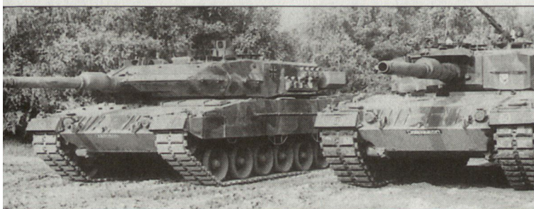
Kampfpanzer «Leopard 2A5» (links) und «2A4» (rechts).

der Folge wurde die Überleitungs- und Realisierungsphase dieses Projektes eingeleitet. Die Zentralverwaltung des BMLV muss bis zum 31. Dezember 2002 die neue Organisationsstruktur umgesetzt haben. Die nachgeordneten Kommanden, Ämter und Dienststellen müssen die neue