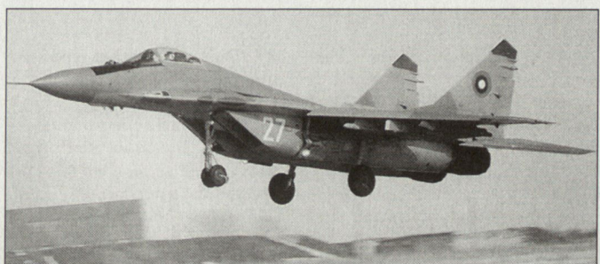
Kampfflugzeug MiG-29 der bulgarischen Luftwaffe.

in Konkurrenz zum deutsch-russischen Joint-Venture-Unternehmen MAPS aufgetreten sind, sprachen vor allem die wesentlich geringeren Kosten. Zudem kann das Geschäft im Rahmen von russischen Schuldentilgungen gegenüber Bulgarien abgewickelt werden. Der Entscheid zu Gunsten RSK MiG hat zur Folge, dass für die europäische Luftfahrtunternehmen EADS keine Aufträge anfallen. Die insbesondere von der deutschen Firma DASA erhofften Modernisierungsaufträge für Kampfflugzeuge MiG-29 in den diversen Nachfolgestaaten der ehemaligen UdSSR können damit vermutlich endgültig abgeschrieben werden. Tatsache ist, dass die russischen Anbieter bezüglich MiG-29-Modernisierung wesentlich günstigere Angebote machen können. hg