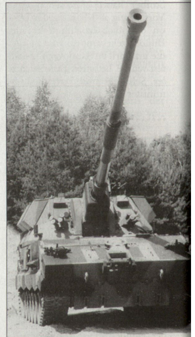
Prototyp der polnischen Panzerhaubitze 155 mm «Krab».

Im Vergleich zur deutschen Panzerhaubitze 2000 wird das polnische Waffensystem leichter und preisgünstiger ausfallen. Anderer-