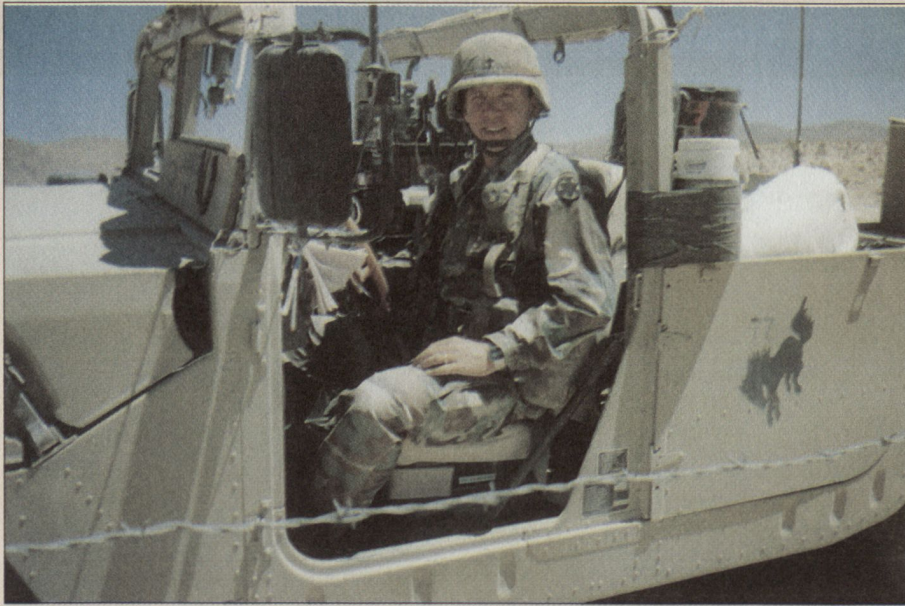
Chapl. Byron J. Simmons, US-Army, im Einsatz irgendwo in der Golfregion.

dies ist typisch für die meisten militärischen Standorte. Menschen, die in die Armee eintreten, sind oft sehr patriotisch, und patriotische Menschen tendieren dazu, gläubig zu sein.