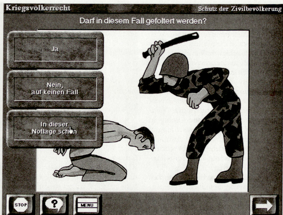
Testfrage aus der CD-ROM Kriegsvölkerrecht.

Nach der Realisierung der Ausbildungsgefässe der ersten Etappe wird