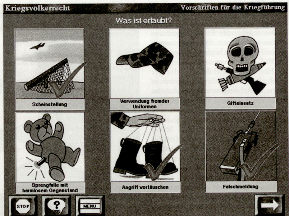
Testfragen aus der CD-ROM Kriegsvölkerrecht.

Das Mittel CD-ROM ermöglicht den Beizug von Graphiken und Bildmaterial, sogar in Form von kurzen