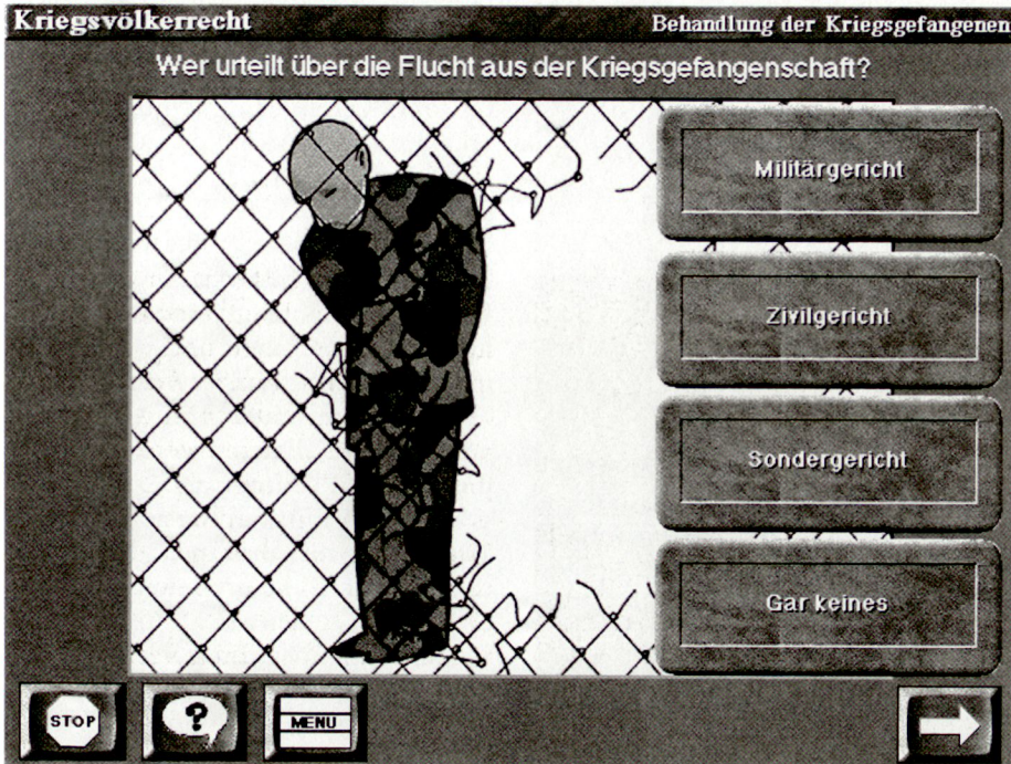
Testfrage aus der CD-ROM Kriegsvölkerrecht.