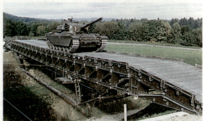
Feste Brücke 69