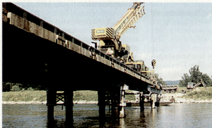
Stahlträgerbrücke mit Komponenten

Im Rahmen der Gesamtverteidigung für die Sicherstellung der eigenen Beweglichkeit und der Versorgung.