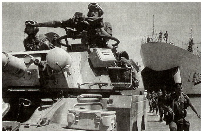
Mit der neuen Heeresstruktur soll die französische Armee die künftigen Aufgaben besser bewältigen können.

In den letzten Jahren wurden insgesamt 653 ungarische Militärpersonen in Schulen und Kursen von NATO-Streitkräften ausgebildet; davon 162 in Deutschland, 154 in den USA, 74 in Kanada, 55 in den Niederlanden und 49 in Grossbritannien.