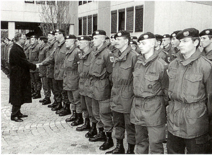
Verabschiedung des Österreichkontingents nach Albanien.

Weise sollen möglichst wenig konfliktauslösende Momente geschaffen werden. Derzeit übernimmt die Schutztruppe nur die Sicherung von humanitären Transporten, Lebensmittellieferungen und einigen Verkehrsrouten.