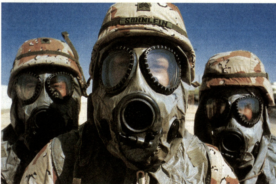
Die gegen den Irak eingesetzten alliierten Truppen mussten sich gegen verschiedenste Nervengifte schützen.

Es gibt keine Massenerkrankungen , die auf den aktiven Einsatz solcher Stoffe als Kampfmittel oder deren passive Freisetzung als Folge von Bombardierungen schliessen lassen. Weder bei der örtlichen Zivilbevölkerung noch bei den Veteranen sind zu diesen Krankheitsereignissen passende Krankheitsbilder aufgetreten.