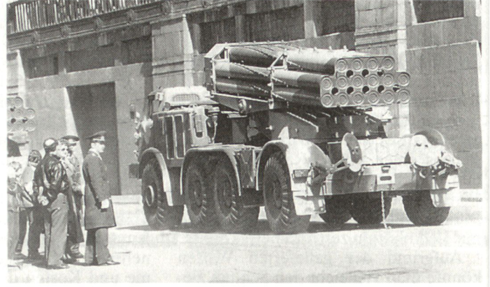
Raketenwerfer «Uragan» 220 mm.