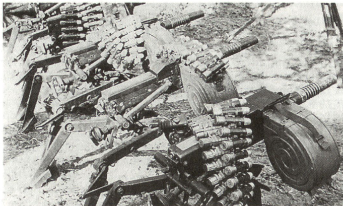
Granatwerfer AGS-17 «Plamya».

gesetzt werden können. Entweder war der Einsatz dieser Panzerabwehrwaffen gegen Pakistan und die Aktivitäten des pakistanischen Geheimdienstes in Afghanistan gedacht oder es war dies eine weitere Abrüstungsmassnahme gegenüber der NATO.