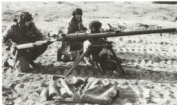
Rückstossfreie Panzerabwehrkanone SPG-9 73 mm.