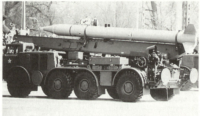
Taktische Boden-Boden-Rakete «Luna-M» (FROG-7).