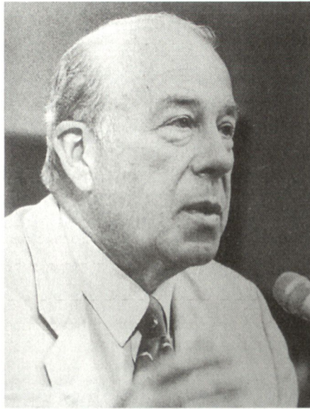
George P. Shultz, Aussenminister der USA von 1982 bis 1989, interessierte sich erst in der letzten Phase des Krieges für Afghanistan, als die Sowjets ernsthafte Anstalten trafen, abzuziehen.