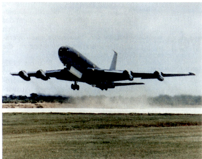
Abb. 3. Air Force / Army / Grumman Joint STARS E-8A. Der 24-foot-Radar-Sensor ist hinter dem Bugrad gut sichtbar.