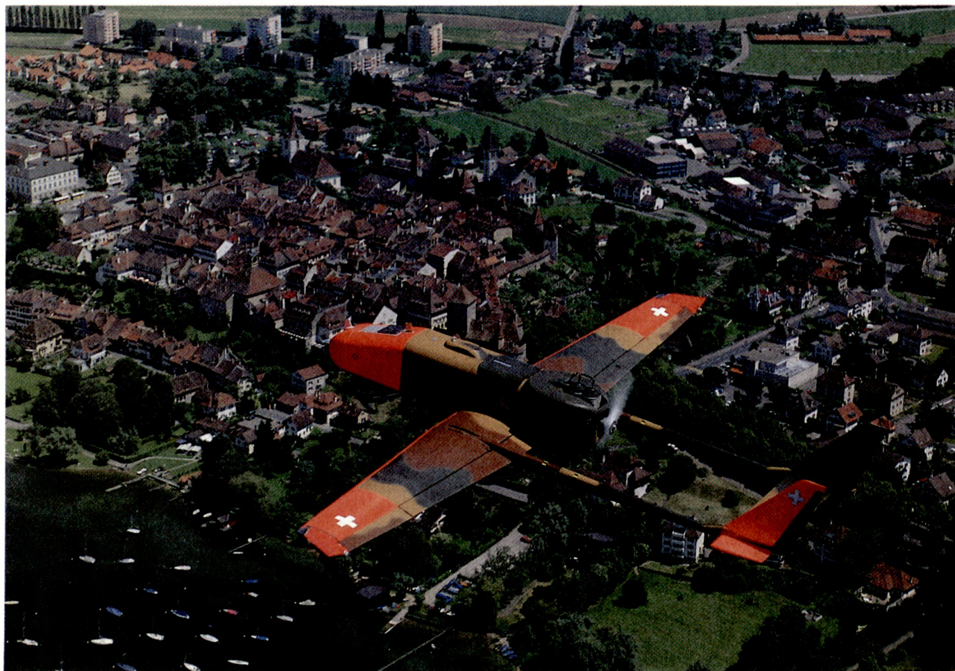
Abb. 5. Aufklärungsdrohne ADS-95, Ranger, über Murten. Vier Systeme ADS-95 sollen für die Schweizer Armee beschafft werden.

dadurch sehr präzise und detaillierte Informationen für den Auftraggeber liefern können.