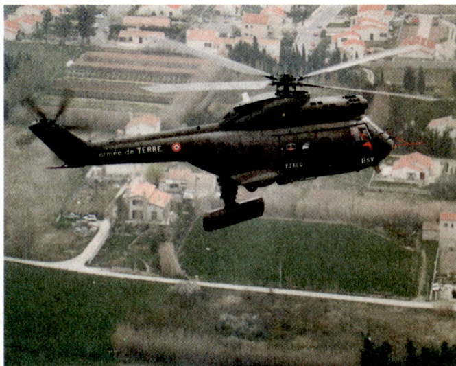
Abb. 4. Super Puma der Armée de Terre Française mit Überwachungs- und Aufklärungsradar unter dem Rumpf. Helikopter und Aufklärungssystem werden «HORIZON» genannt.