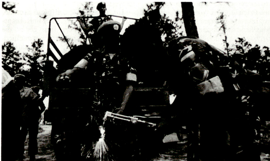
Zerstörung von Waffen, welche die Blauhelme beschlagnahmt haben. Soldat aus Venezuela in der ONUCA, Nicaragua.