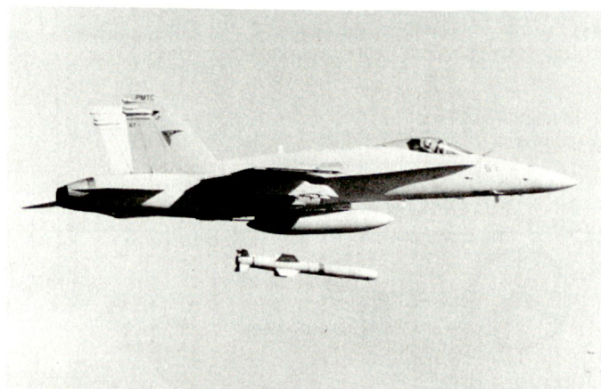
«SLAM» (Standoff Land Attack Missile) Abstandslenkwaffe mit sehr grosser Reichweite der USA.

Hier kurz nach dem Abschuss ab einem U.S. NAVY F/A-18. Im Ernstfall bewährt ab A-6E und F/A-18. Die Endanflug-Kontrolle kann auch von einem anderen Flugzeug übernommen werden, dazu ist Datalink (AWW-9 oder AWW-13) notwendig.