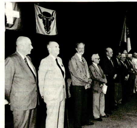
Die neuen Ehrenveteranen. Im Vordergrund alt Ständerat Franz Muheim

In seinem Bericht hielt der Zentralobmann kurz Rückschau auf vergangene Geschäfte der Vereinigung. Aus Anlass des 100jährigen Bestehens des UOV Baden wurde die nächste Tagung auf den 11. Juni 1994 in Baden festgelegt. Zum Mitgliederbestand wusste Jules Faure zu berichten, dass gegenüber dem Vorjahr eine Erhöhung um 257 Mitglieder auf neu 5233 stattfand.