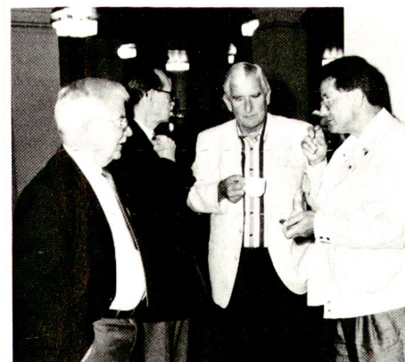
Gespräche bei der Kaffeerrunde