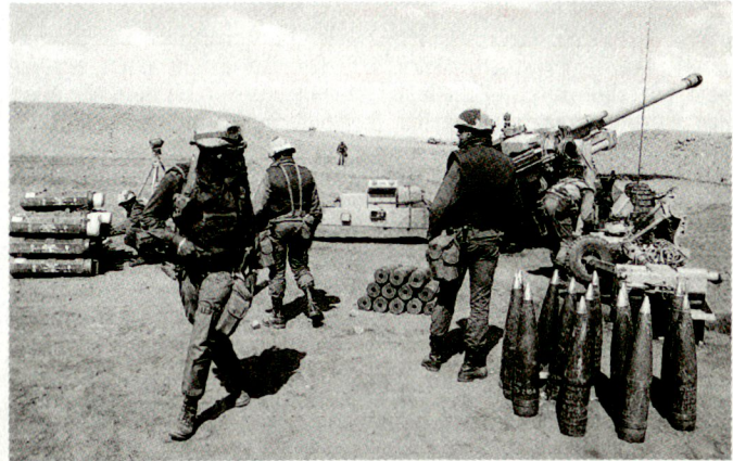
Die französische Artillerie (Bild: Kan 155 mm TRF1) hat erstmals im Golfkrieg für die Echtzeitaufklärung das MART-System eingesetzt.

dass Österreich nicht als Bittsteller zur WEU kommen, sondern dass es auch viel einzubringen hätte: Österreich bildet eine stabile Säule in einem ansonsten sehr empfindlichen geopolitischen Bereich. Zum zeitlichen Horizont befragt, meint der Minister realistisch, dass eine Vollmitgliedschaft bei der WEU erst nach einem EG-Beitritt möglich sei. TPM