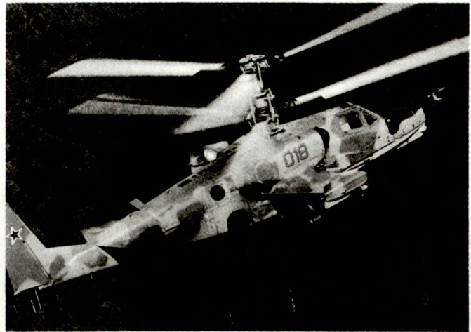
Der neue Kampfhelikopter Ka-50, der heute von der russischen Firma Kamov zum Verkauf angeboten wird. Zur Standardbewaffnung gehört die neue lasergelenkte Panzerabwehrwaffe AT-9.

Es ist falsch, von diesen neuen Technologien eine «Vermenschlichung» des Krieges zu erwarten. Einige dieser Technologien können auch dem Menschen gefährlich werden. So können Laserwaffen zur Erblindung führen, polymere Klebstoffe werden nicht nur Fahrzeuge und Material immobilisieren. Diese Klebstoffe, Teflonbeläge, auf Strasse und Schiene gesprüht, oder chemische Zusätze in Treibstoffen können zu heute noch nicht abschätzbaren ökologischen Schäden führen. Andererseits lassen sich mit diesen Technologien bewaffnete Konflikte ohne grosse menschliche Verluste beenden. Sie könnten damit zu einem politisch akzeptierbaren Instrument der regionalen Krisenbewältigung werden. MH