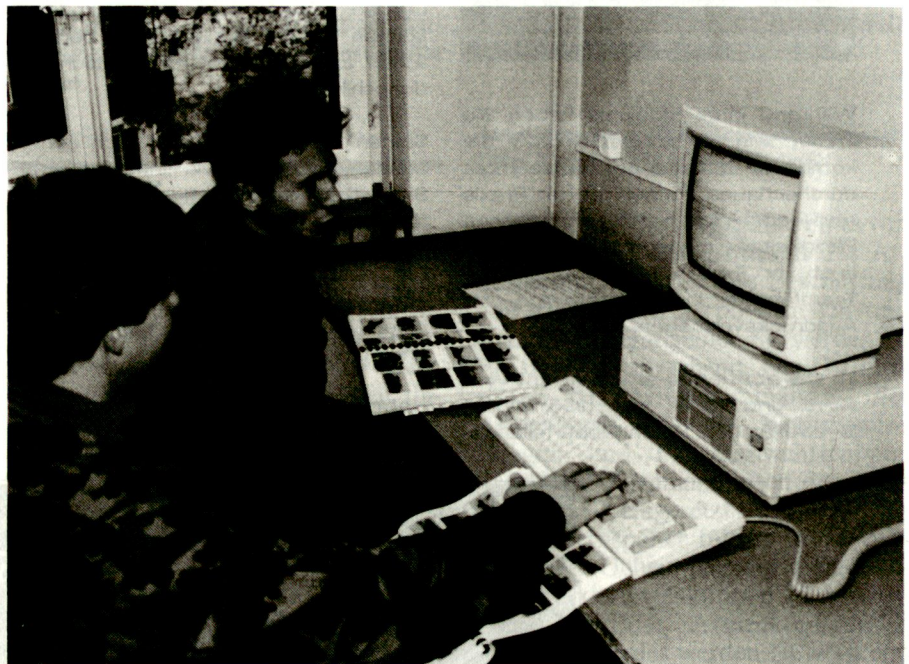
Einsatz des computerunterstützten Lernprogrammes für die nachrichtendienstliche Ausbildung der Fernspäher.

Die Ausbildung der Fernspäher-Anwärter erfolgt in der Fernspäh Schule auf dem Waffenplatz Locarno und dauert bis zur Brevetierung des Soldaten 22 Wochen. Sie ist unterteilt in 17 Wochen Rekrutenschule, 1 Wo-