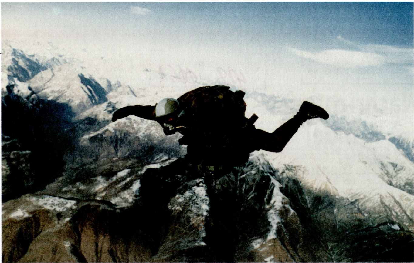
Fernspäher in voller Einsatzrüstung bei einem Sauerstoff-Fallschirmabsprung (Foto: R. Gimmi).

che Anwärter-Trainingskurs und 4 Wochen Fachschule. Im Verlauf der Ausbildung werden die Anwärter verschiedensten psychischen und physischen Belastungen ausgesetzt. Sie gehört zu einer der härtesten Ausbildungen in der Schweizer Armee. Der Rekrut erhält eine umfassende fernspäh-spezifische Ausbildung. Diese umfasst eine militärische Allgemeinausbildung, Kenntnisse in der Uem-Technik, Infiltrationstechniken, ND-Kenntnisse, Einzelkämpferausbildung, spezielle Überlebenstechnik im Einsatzgebiet, Gebirgsausbildung (Schnee/Fels) sowie eine militärische Fallschirmausbildung (Tag/Nacht).