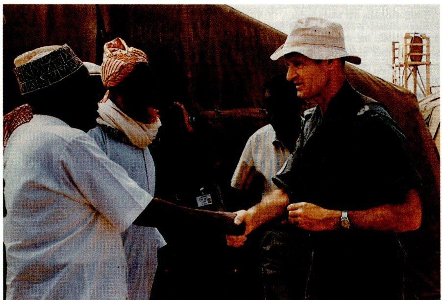
Oberst H. Harff , Kommandeur des Unterstützungsverbandes Somalia «UNOSOM II», im Gespräch mit Clanchefs der Hawiye und einem UN-Dolmetscher. (BMV)

gessen werden, dass die Hungersnot und Anarchie in Somalia ausschliesslich auf das Konto der marodierenden Soldatenhaufen und der hinter ihnen stehenden Clanchefs ging. Lebensmittel und Hilfsgüter standen stets in ausreichendem Masse in den Hafenstädten und Lagern des Landes zur