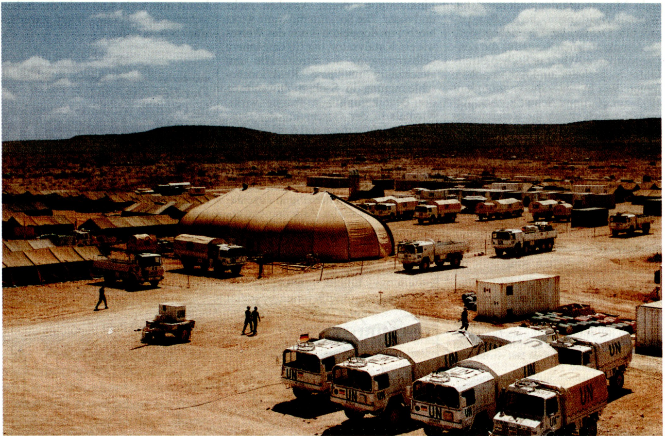
Versorgungsbereich des deutschen Lagers am Stadtrand von Belet Uen. In der Mitte Kühlzelt für die Trinkwasserbehälter.

schen Sinne betriebenen «Menschenrechtsimperialismus» ab. Was tut aber die Bundeswehr wirklich, nachdem die deutsche Regierung im vergangenen Jahr wiederholte Male vom UN-Generalsekretär Butros Butros Ghali um Unterstützung gebeten wurde?