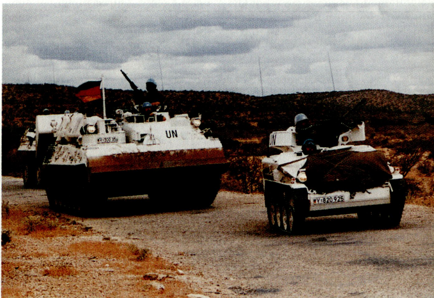
Pionierpanzer 2 «Dachs» mit Begleitschutz durch «Wiesel 1» auf der Nationalstrasse zwischen Bulu Burti und der Flugpiste bei Belet Uen.

«Die Verhaltensmassregeln für unseren Verband werden mit den Vereinten Nationen sorgfältig abgestimmt. Es ist unseren Soldaten verboten, den Auftrag des Unterstützungsverbandes mit Waffengewalt durchzusetzen oder bei der Ausübung militärischen Zwangs durch andere mitzuwirken. Davon unberührt bleibt das Recht auf Selbstverteidigung, einschliesslich Nothilfe. Ausschliesslich diesem Zweck dienen die gepanzerten Transportfahrzeuge und die übrige Bewaffnung der Soldaten.»