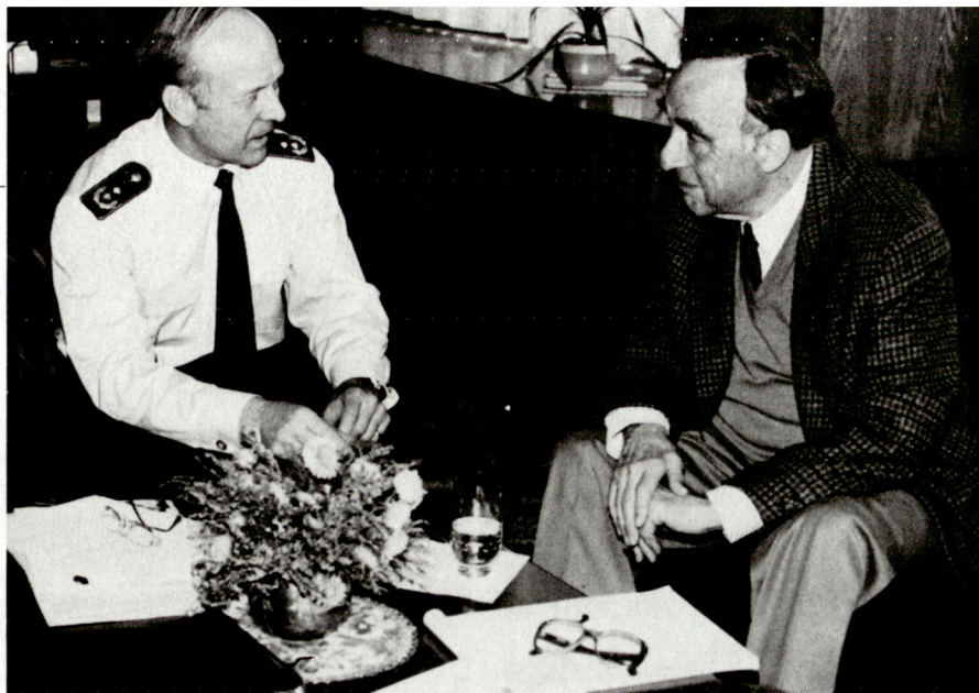
Generalmajor Ekkehard G. Richter stammt aus der Bundeswehr. Er ist heute Divisionskommandeur und Befehlshaber im Wehrbereich VII (WBK VII). Diese Stellung lässt sich in sehr grober Annäherung mit jener eines Schweizer Divisionärs vergleichen, dem neben mehreren modernen Kampfbrigaden noch territorialdienstliche Verbände und Waffenplatzverwaltungen unterstellt wären.

(Handbuch für den Politoffizier der Stufe Bat/Kp, Militärbezirk III, Ausgabe 1984)