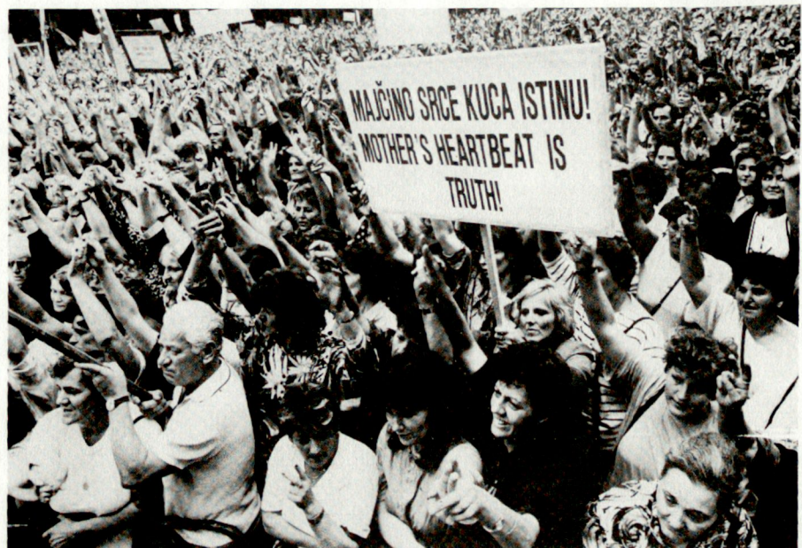
Protest vor dem Hauptquartier der jugoslawischen Armee in Zagreb: Kroatische Eltern verlangen die Freigabe ihrer Söhne («Vecernji List»).

Es bestätigte sich auch in Belgrad und Zagreb Marschall Blüchers Rat von 1813 an den Berichtersteller Görres: «Schreiben Sie nur immerzu, gegen wen es auch sei – aber das sag ich Ihnen: wahr muss es sein».