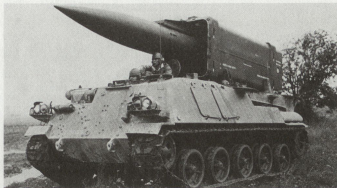
Die taktischen Boden-Boden-Raketensysteme Pluton (siehe Bild) sollen in nächster Zukunft durch Hadès abgelöst werden.

Frankreichs Sicherheit stützt sich weiterhin auf die nukleare Dissuasion, deren Kräfte durch den Präsidenten der Republik eingesetzt werden können. Vorhanden sind: