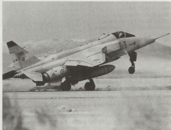
Mehrzweck-Kampfflugzeug Jaguar, ausgerüstet mit Luft-Boden-Lenkstoff AS-30.