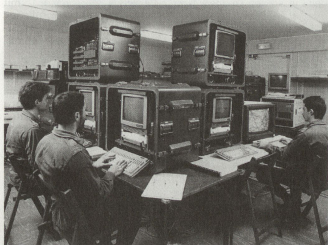
Komponenten des automatisierten Führungssystems RITA. Menschen und Maschinen synthetisieren eine grosse Informationsmasse auf einem KP, um Entscheidungshilfen zu bieten.

Die vor Ausbruch dieses Konfliktes vorgenommenen