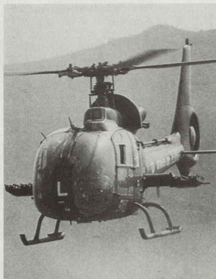
Helikopter Gazelle (Version Celtic) waren im Golfkrieg erstmals auch mit Luft-Luft-Lenkstoff Mistral ausgerüstet.

Wenn sie ausserhalb des Mutterlandes eingesetzt werden, müssen die Luftstreitkräfte allerdings über ein mobiles, engmaschiges, gut geschütztes Übermittlungsnetz verfügen. Dieses muss mit den Führungsmitteln eventueller Alliierten kompatibel sein. Bt (Aus Armées d'aujourd'hui, Mai 91)