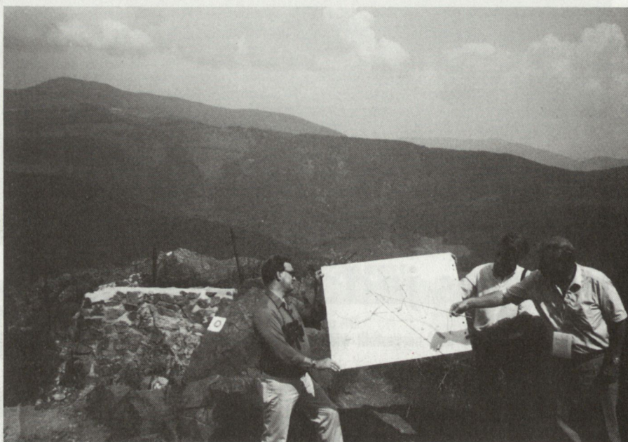
Erkundung als aufrüttelndes Erlebnis: Hartmannsweilerkopf

ASMZ: Wem steht die Mitgliedschaft zur GMS offen und wer beteiligt sich vor allem an diesen Reisen?